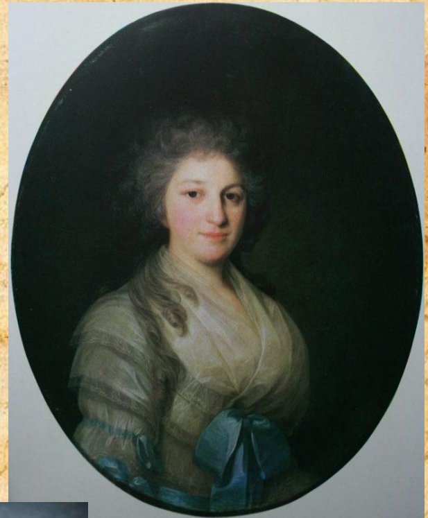
Ф. Рокотов «Протрет неизвестной»