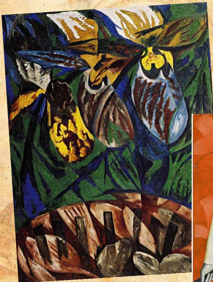
Н. Гончарова «Орхтдеи»

Работы мастеров русского авангарда: М. Ф. Ларионова, Н. С. Гончаровой, О. В. Розановой, К. С. Малевича, В. В. Кандинского, произведения современных художников