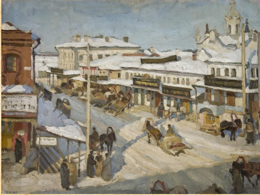
К. Юон «Морозный день Нижний Новгород»