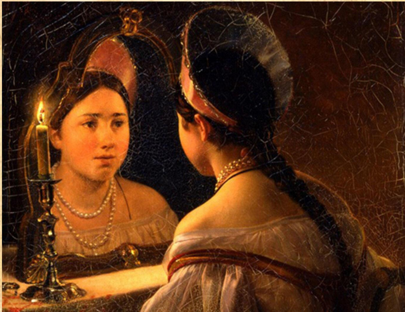
К. Брюллов «Гдающая Светлана»

Гордостью музея являются произведения русских живописцев XVIII—XIX вв.: