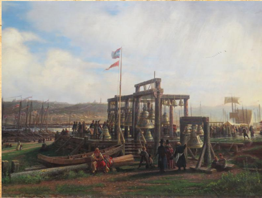
А. Боголюбов «Нижегородская ярмарка. Колокольный ряд»

Собрание НГХМ хранит множество работ, посвященных нашему городу, созданных в период от XIX века до современности. В живописную антологию «царственно поставленного города» вписали свои страницы А. Боголюбов, П. П. Верещагин, А. К. Саврасов и другие именитые живописцы.