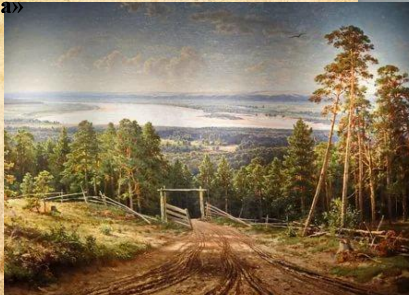
И. Шишкин «Кама близ Елабуги»