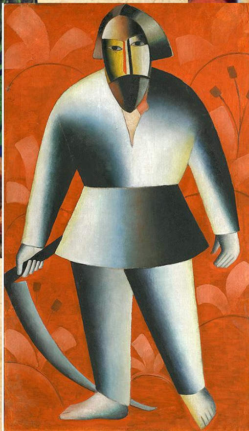
К. Малевич «Косарь»