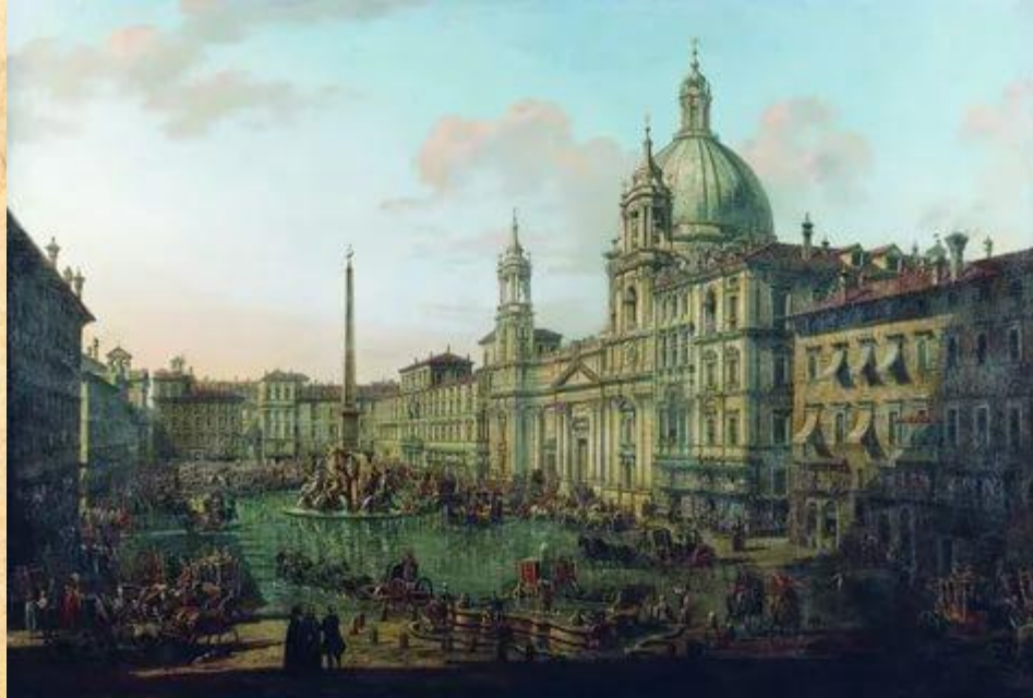
Б. Белотто «Площадь Навона в Риме»