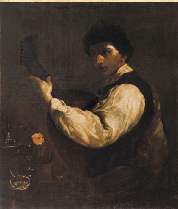
Д.-М. Креспи «Юноша с Лютней»

Коллекция западноевропейского искусства включает в себя произведения XV — нач. XX вв. ведущих национальных художественных школ Италии, Германии, Фландрии, Нидерландов, Голландии, Франции, Англии. Западноевропейская коллекция включает работы известных мастеров этих школ: итальянской французской — Ж. Ф. Милле, Л. А. Г. Буше, немецкой — Л. Кранаха Старшего, голландской и фламандской — Я. Викторса, Д. Тенирса Младшего Я. Йорданса, образцы европейской гравюры XVII—XVIII веков.