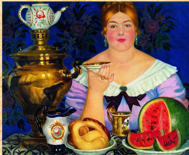
«Купчиха , пьющая чай»