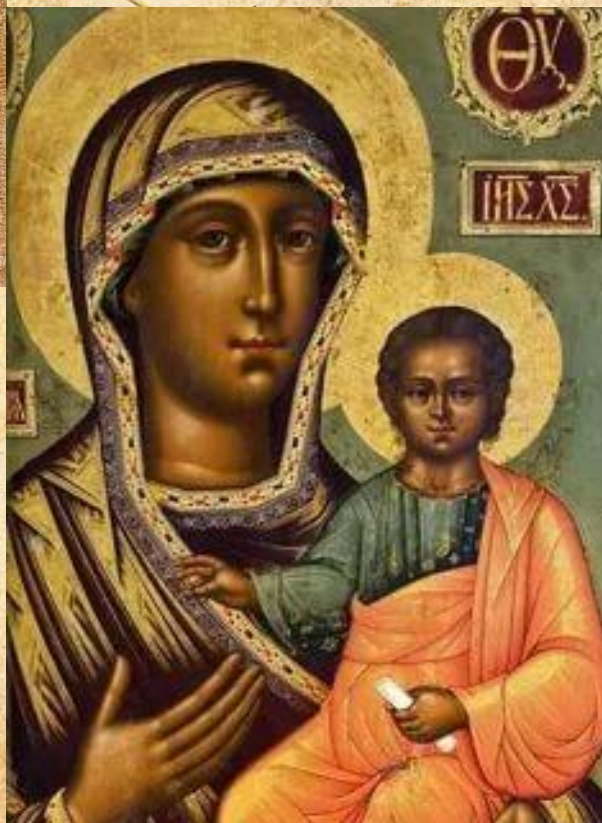
К. Уланов Богоматерь (Смоленская)

Коллекция древнерусского искусства включает в себя иконы XIV—XIX вв., лицевое шитьё, художественное серебро, книжную миниатюру. Декоративно-прикладное искусство представлено произведениями мастеров нижегородских художественных промыслов .