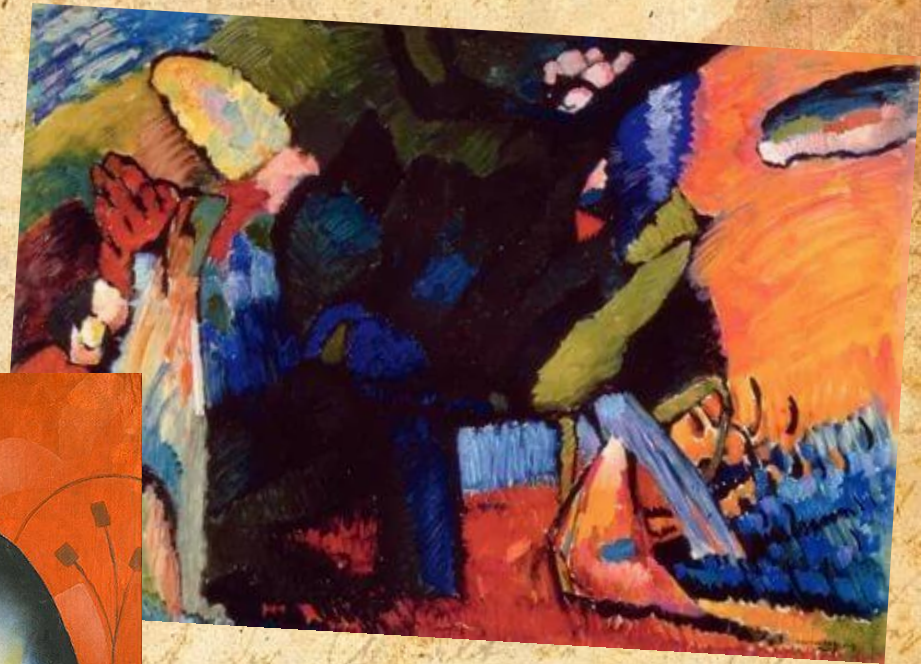
В. Кандинский «Импровизация 4»