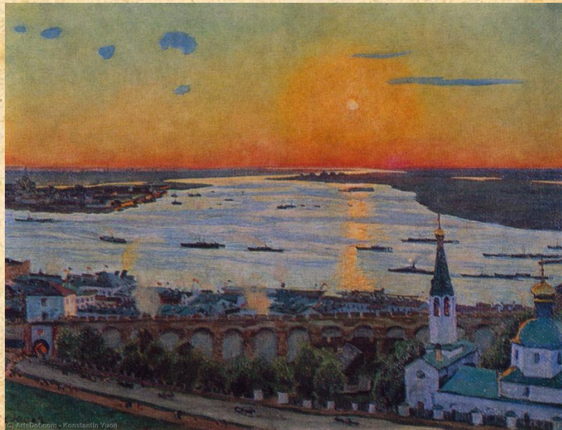
К. Юон «Закат на Волге Нижний Новгород»

Собрание НГХМ хранит множество работ, посвященных нашему городу, созданных в период от XIX века до современности. Особое место среди них занимают графические и живописные работы художника Константина Юона. Красота Нижнего Новгорода еще в юности покорила художника. Неоднократно он приезжал сюда работать. Его первый нижегородский пейзаж был написан зимой 1902 года. . Константин Юон представляет зрителю вид на современную улицу Рождественскую