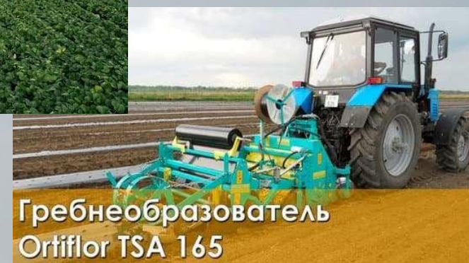
Гребнеобразователь Ortiflor TSA 165