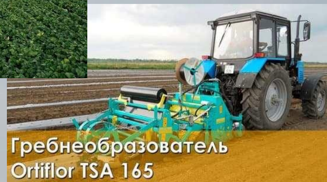
Гребнеобразователь Ortiflor TSA 165