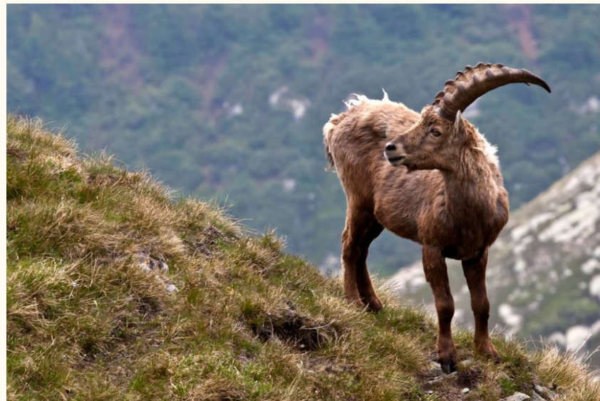
Пиренеский козел (козерог)