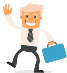
Схема оплаты квартиры по карте