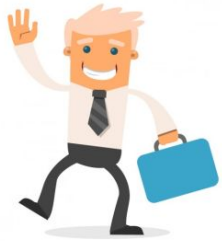
Схема оплаты квартиры по карте