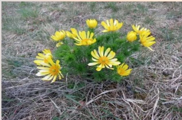
Адонис весенний, или горицвет

В лесах Перми и края растут растения и грибы, занесенные в красную книгу, например: