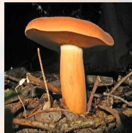
Гриб подмолочник, или молочай