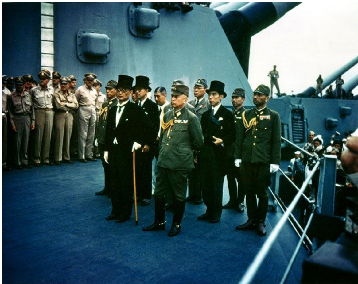
Представители Японской империи.