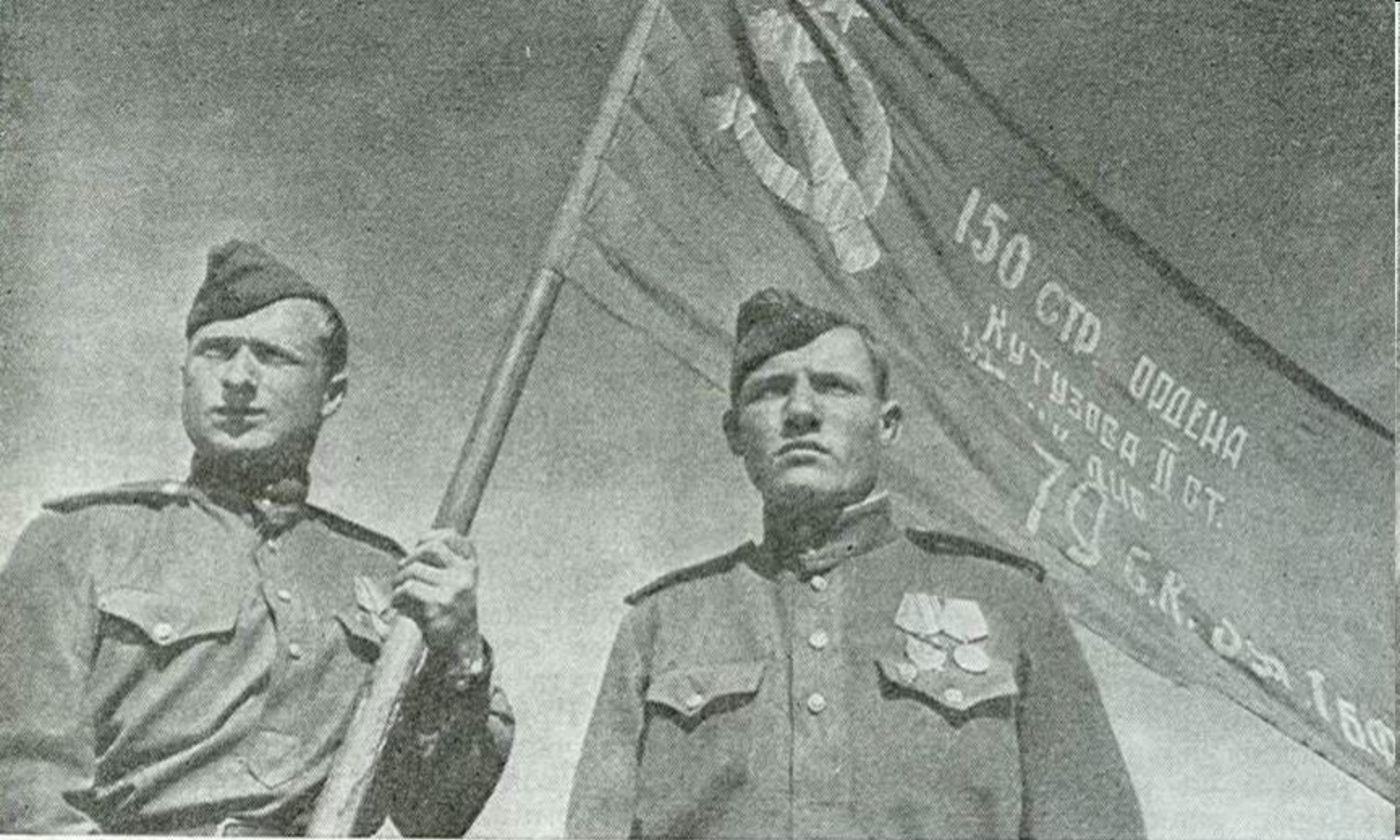
Разведчики 756-го полка 150-й стрелковой дивизии М. А. Егоров (справа) и И. В. Кантария со Знаменем Победы. Берлин. Май 1945.