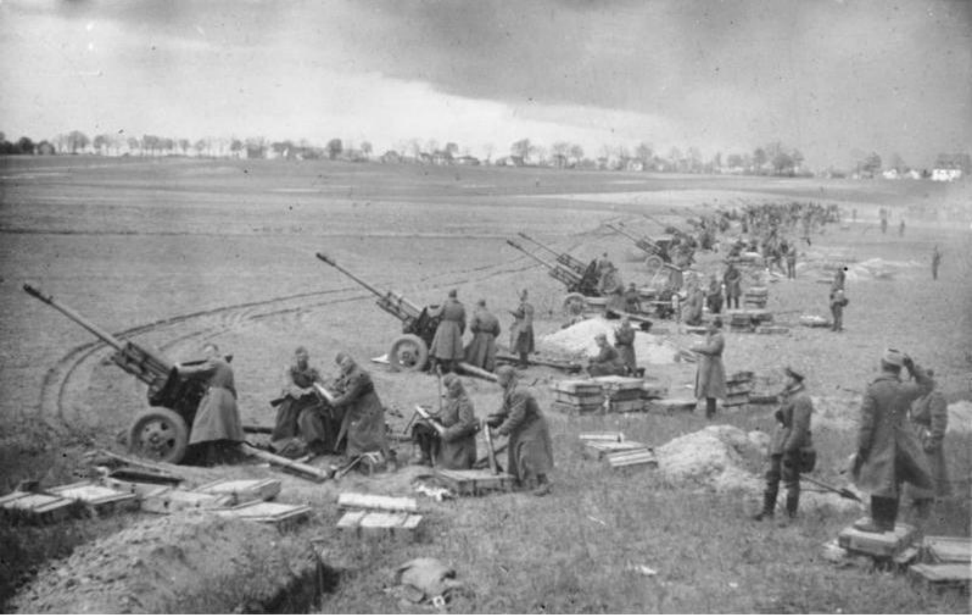
Советская артиллерия на подступах к Берлину.