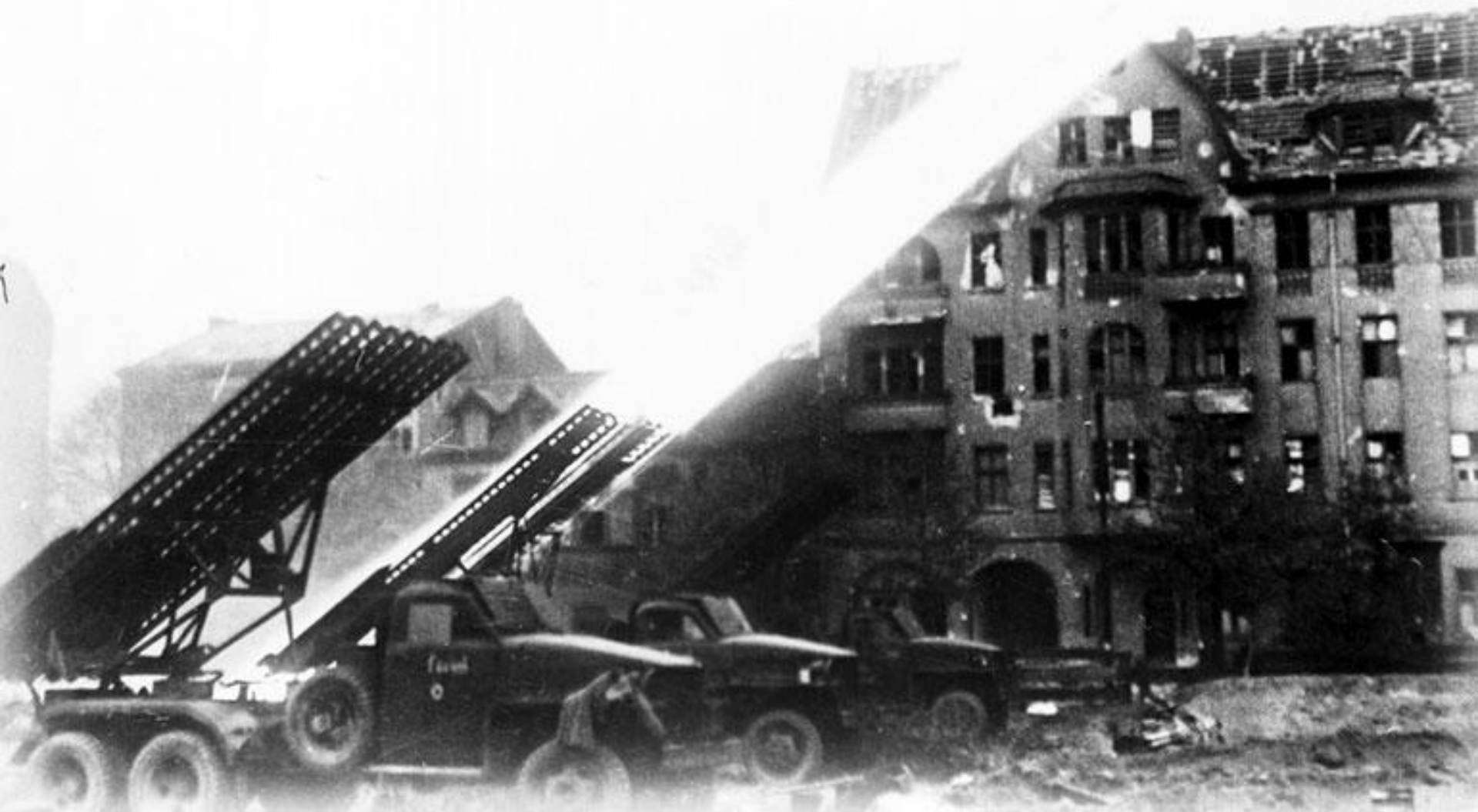
Залп советских реактивных установок «Катюша» по Берлину