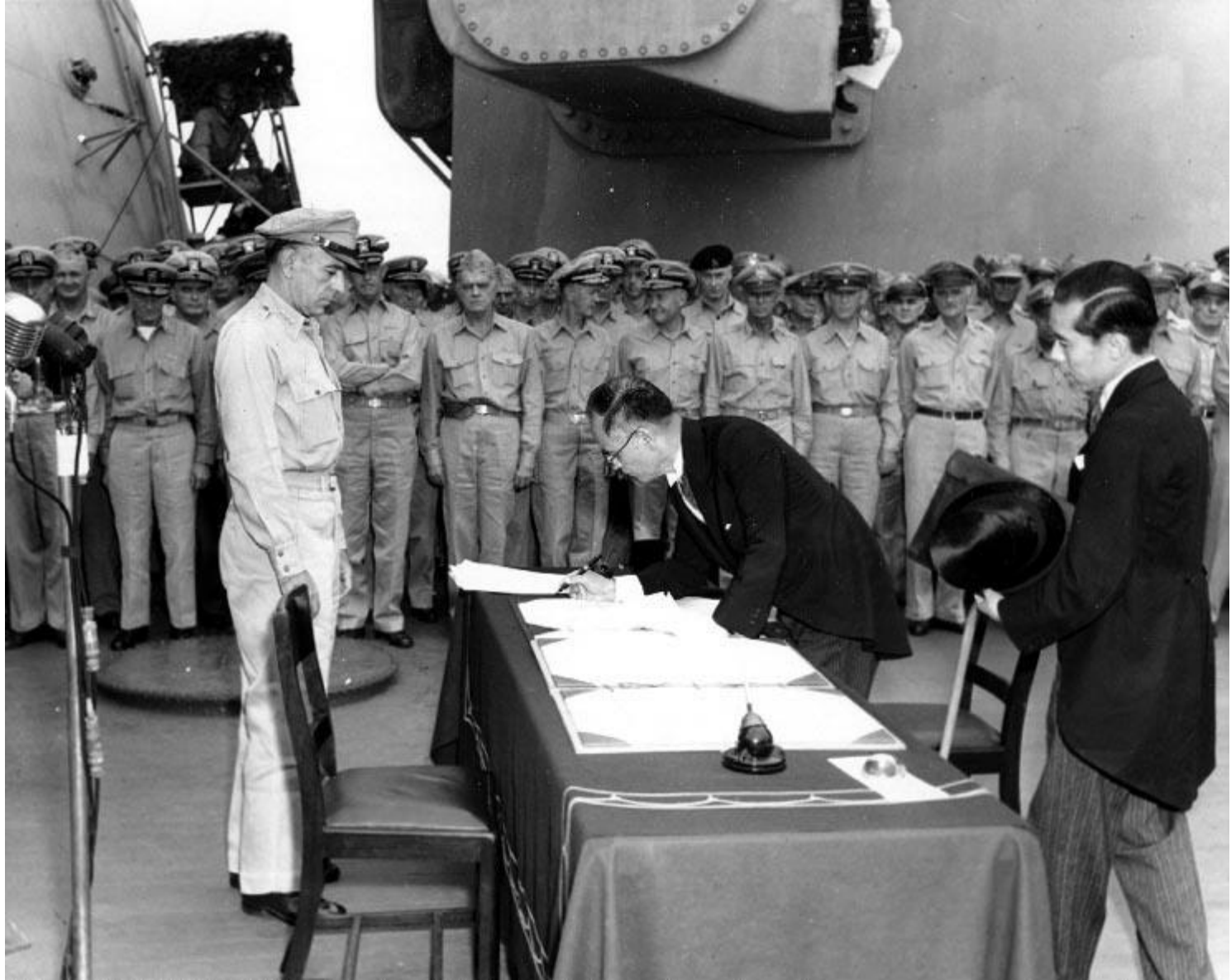
Акт подписал Сигэмицу Мамору - министр иностранных дел Японской империи.