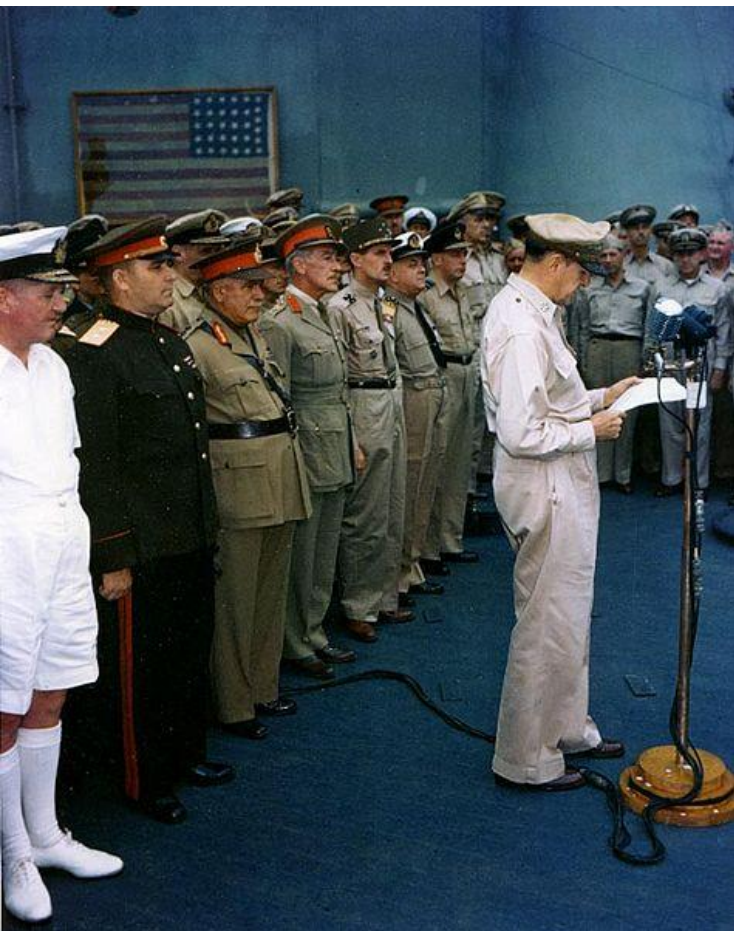
Союзники. Генерал Макартур читает речь.