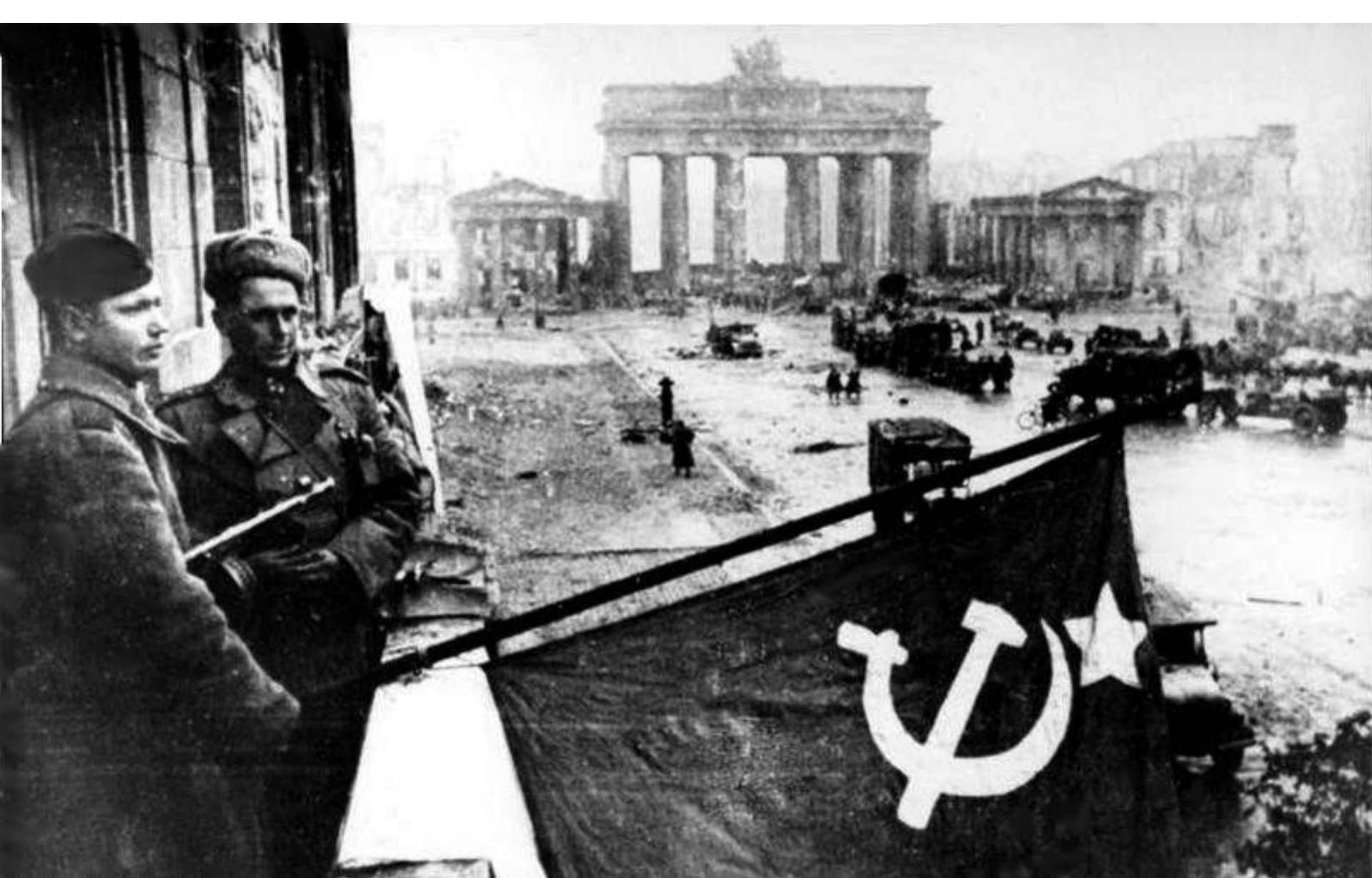
Советские войска на бульваре Унтер-ден-Линден