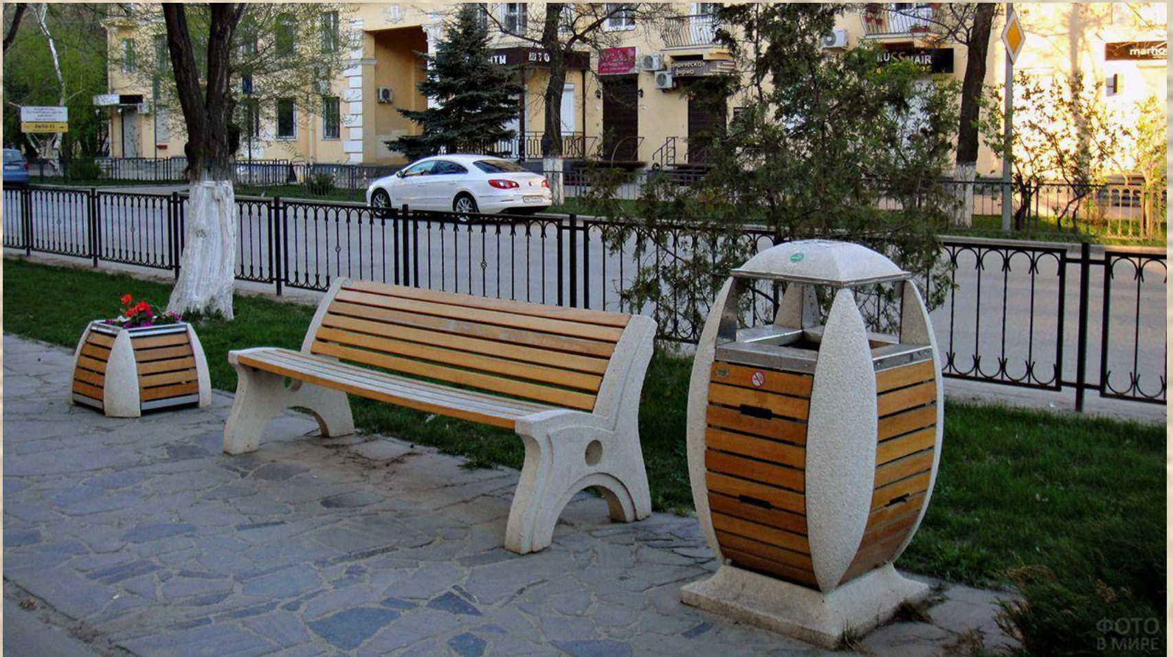
ФОТО В МИРЕ