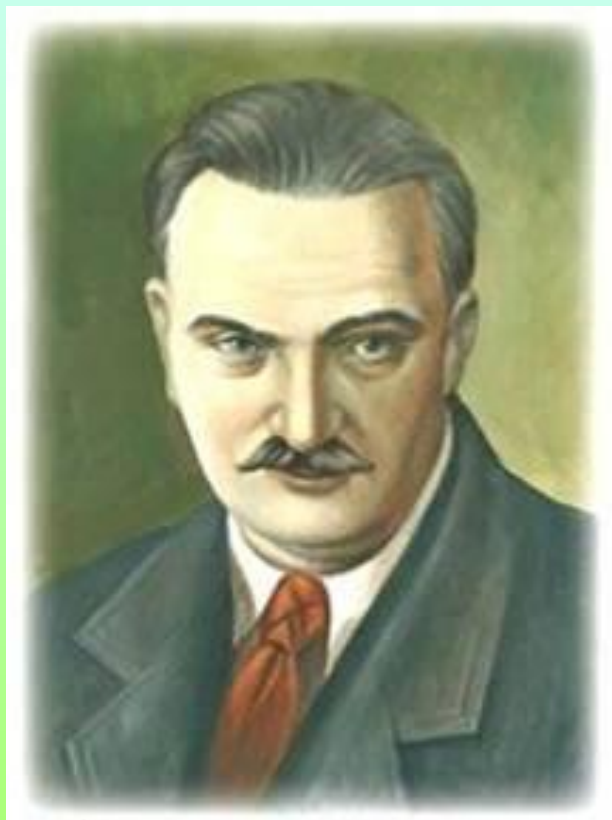
Виталий Валентинович Бианки