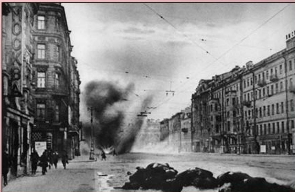
Обстрелы города, нет воды и тепла

900 дней и ночей находился город в осаде. А до линии фронта можно было доехать на трамвае.