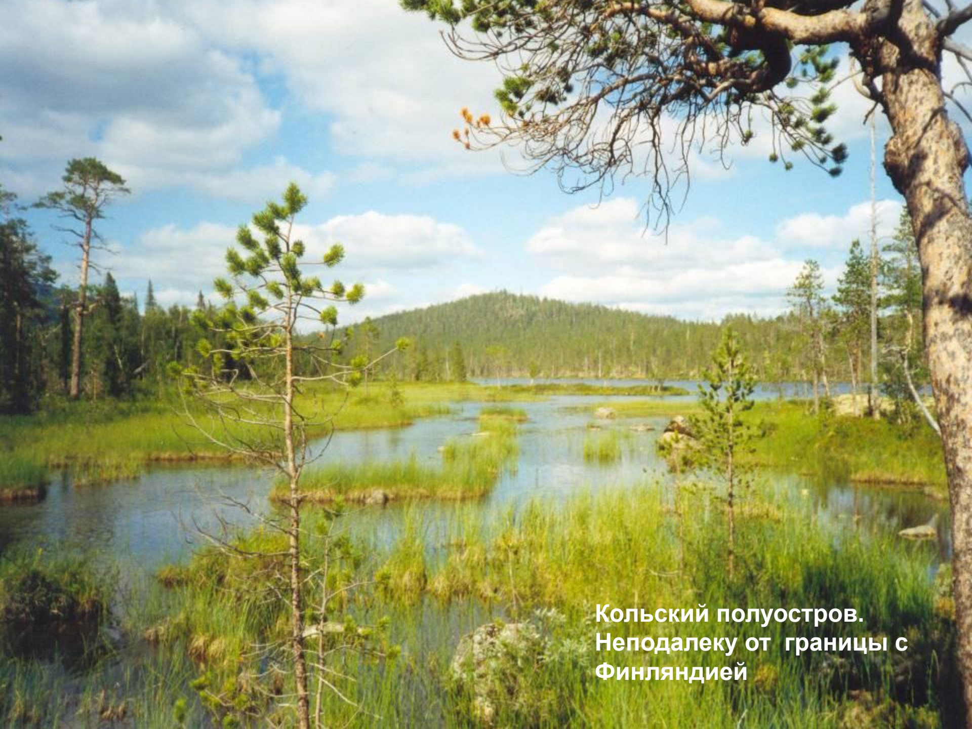
Кольский полуостров. Неподалеку от границы с Финляндией