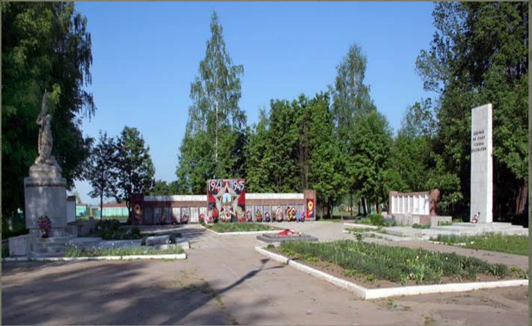
Мемориал в г. Сухиничи