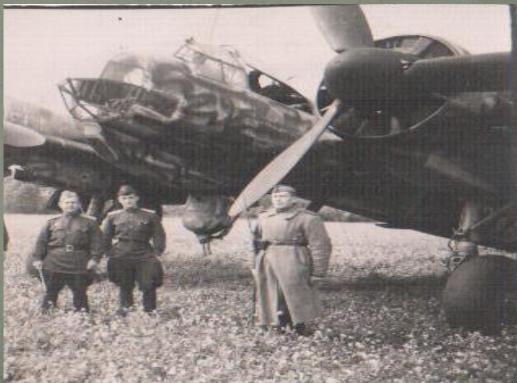
Фронтовые фотографии из архива семьи Сгибневых