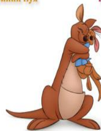
Кенга и Крошка Ру