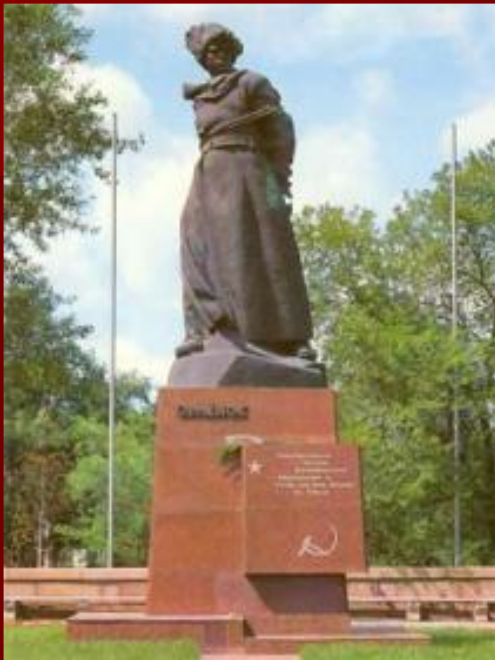
памятник Орленку в Челябинске