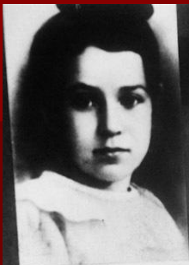
Портрет Ленинградской школьницы Тани Савичевой