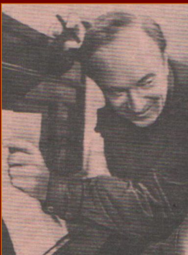
В.И. Лебедев - Кумач