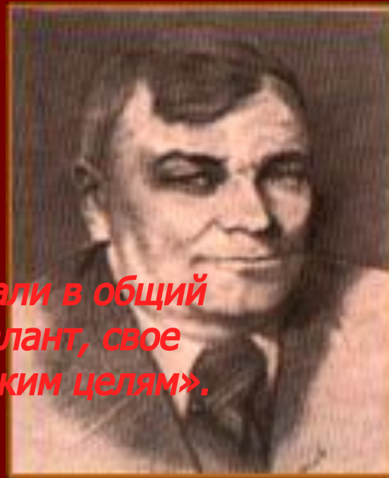
Александр Дмитриевич Чуркин

«..Мастера искусств встали в общий строй, подчинив свои талант, свое мастерство патриотическим целям».