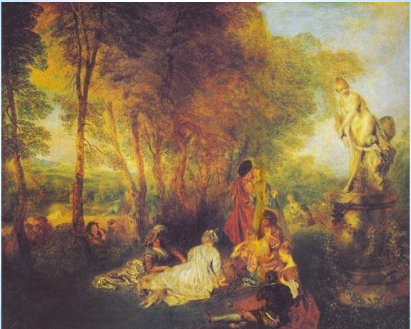
* Ж. А. Ватто «Праздник любви»