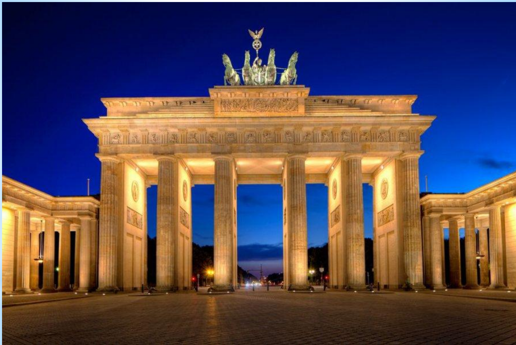
* Бранденбургские ворота