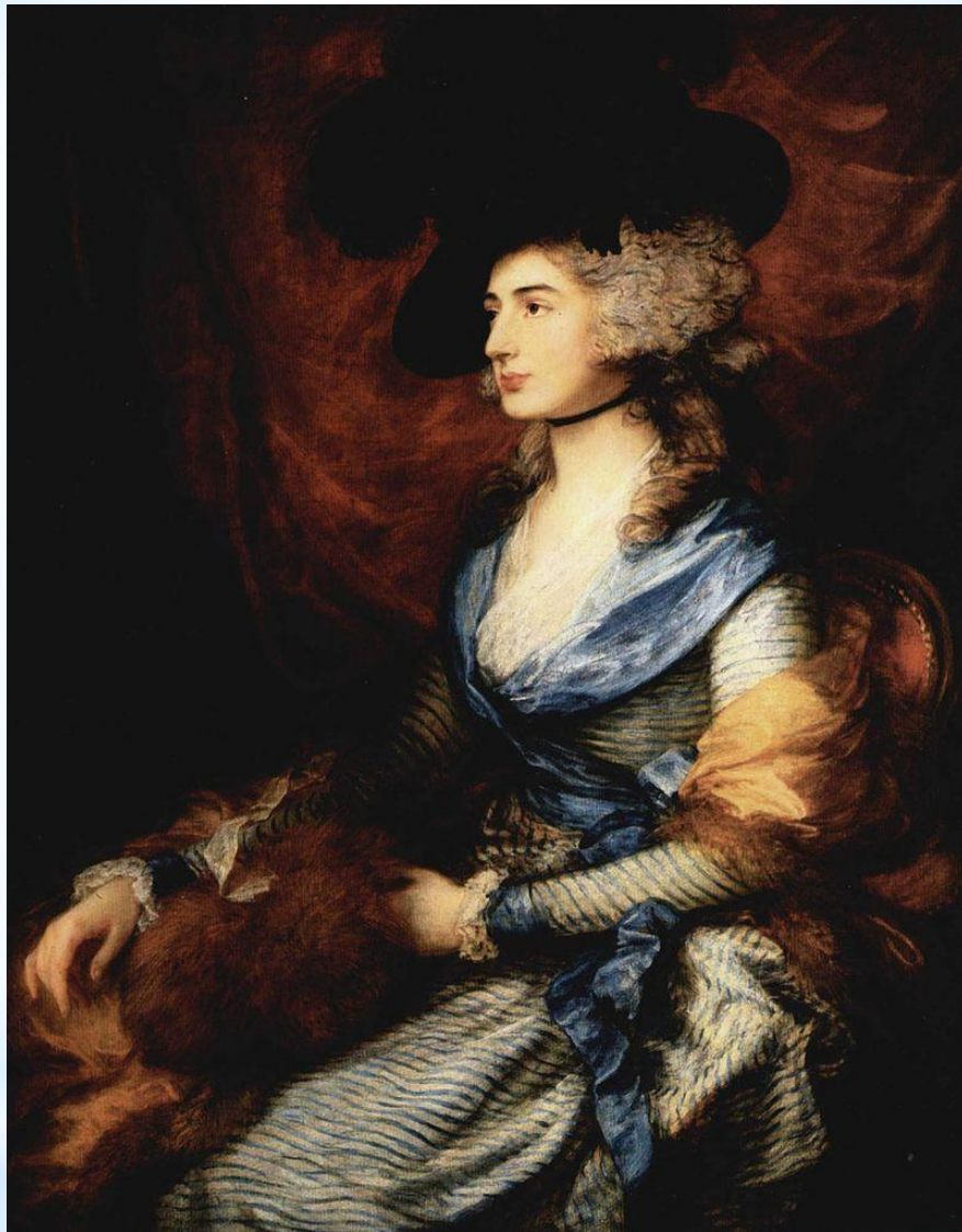
* Томас Гейнсборо Портрет Сары Сиддонс (1785)