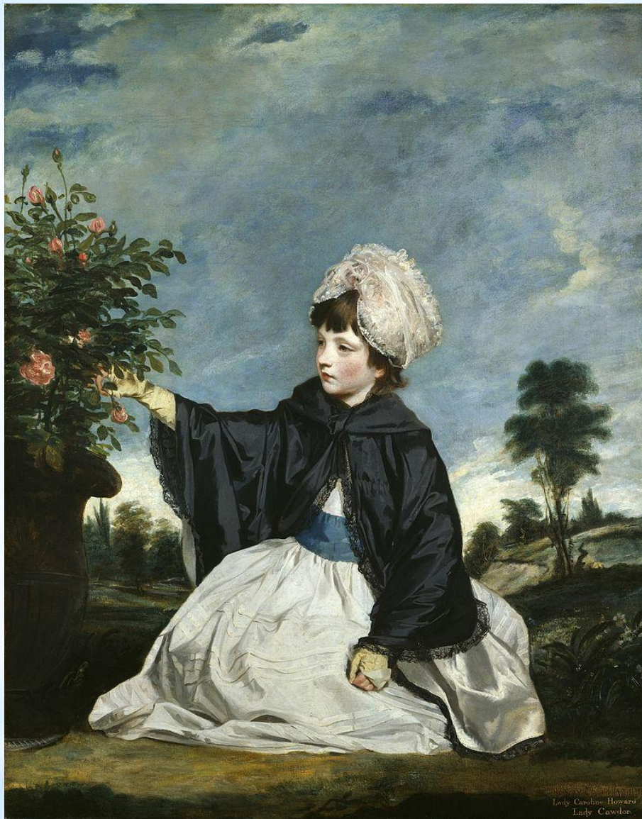
* Леди Каролина Говард