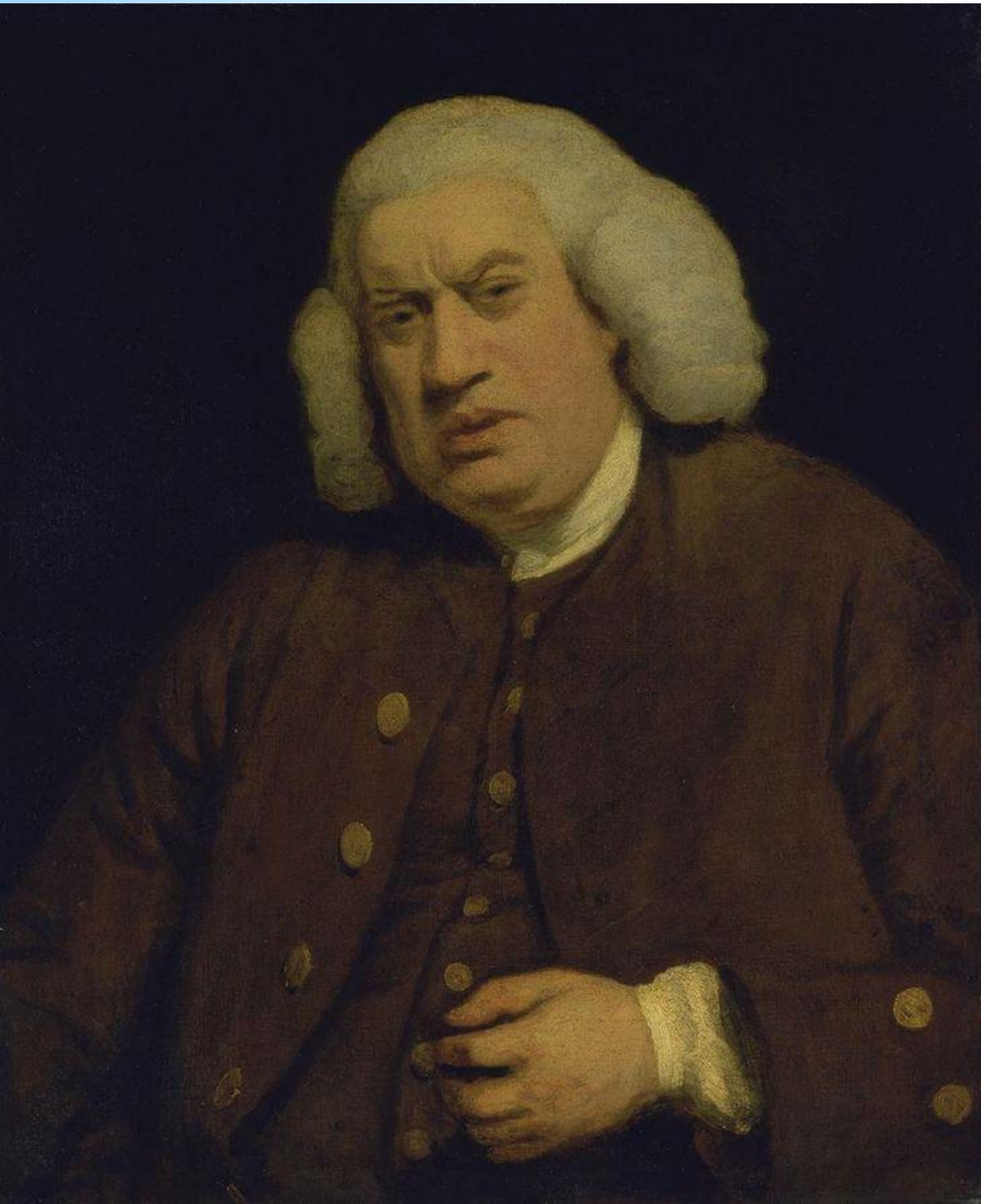
* Портрет С. Джонсона