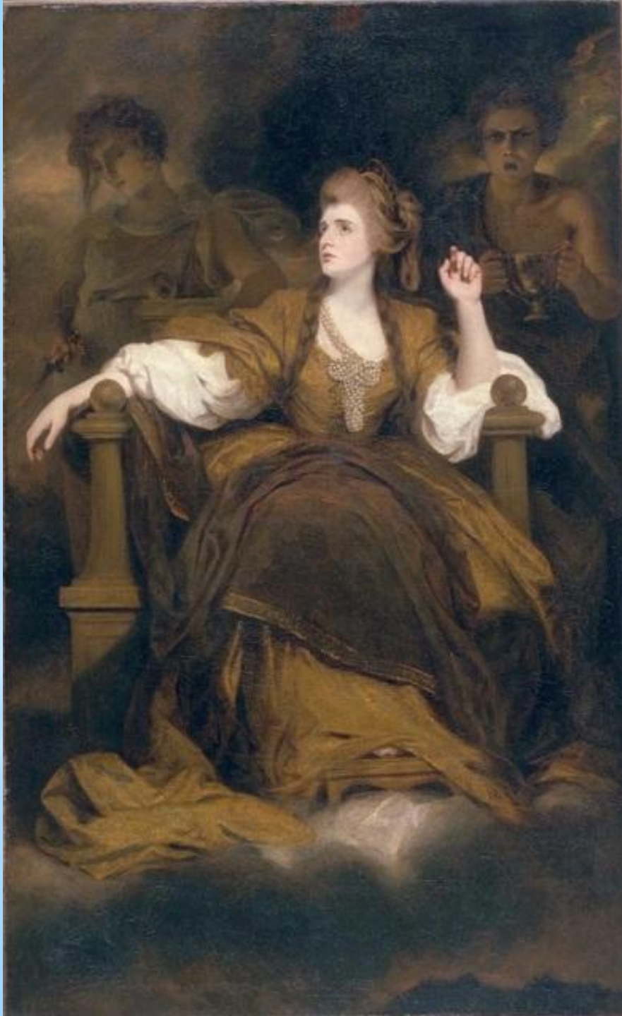
* Д. Рэйнольдс «Портрет Сары Сиддонс»