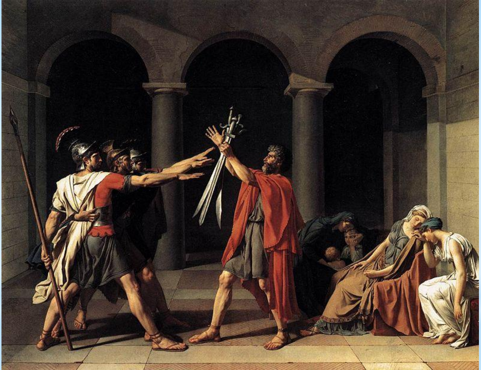
* Клятва Горацев. 1784.