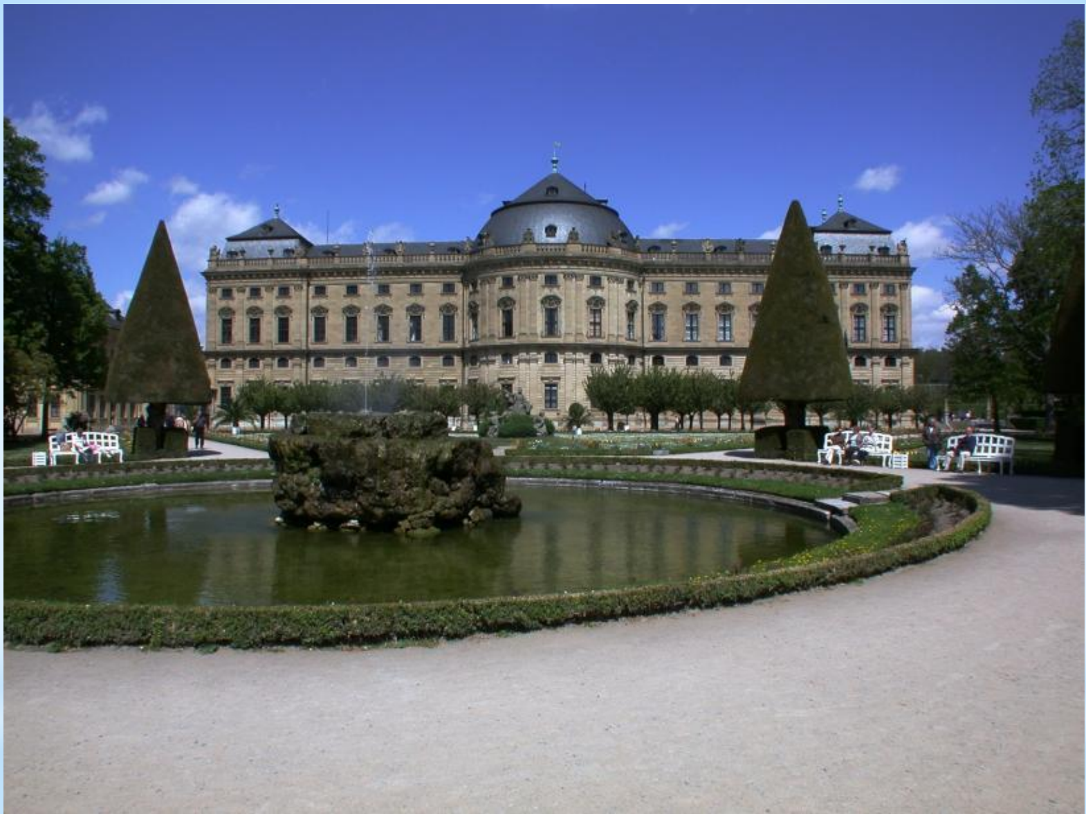
* Резиденция епископа - курфюрста в Вюрцбурге