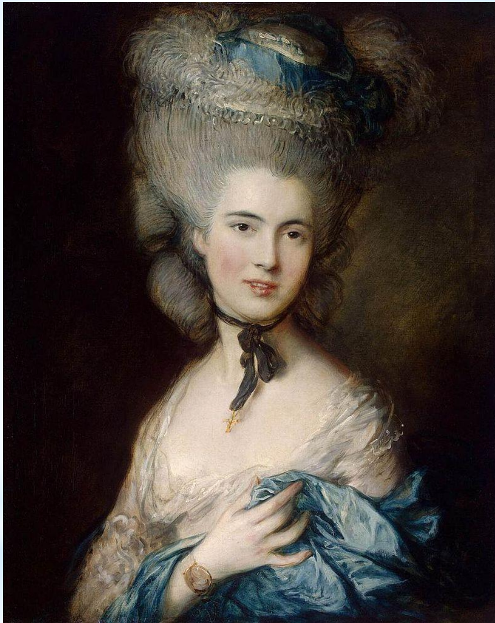
* «Дама в голубом»