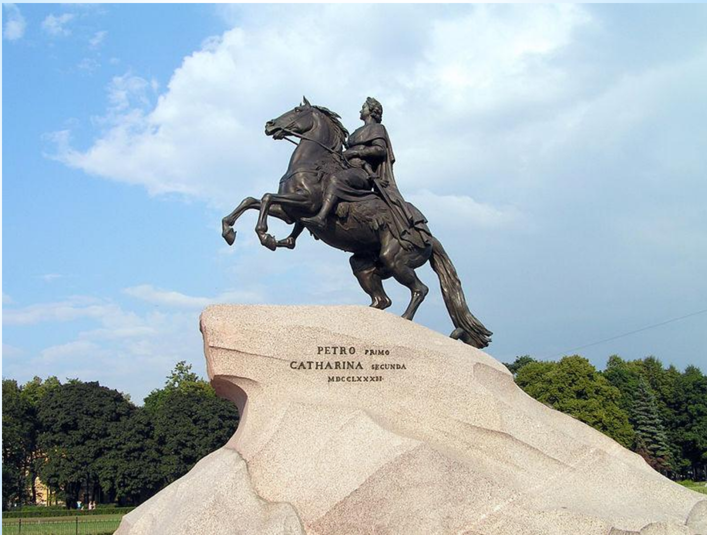
* Фальконе. Медный Всадник