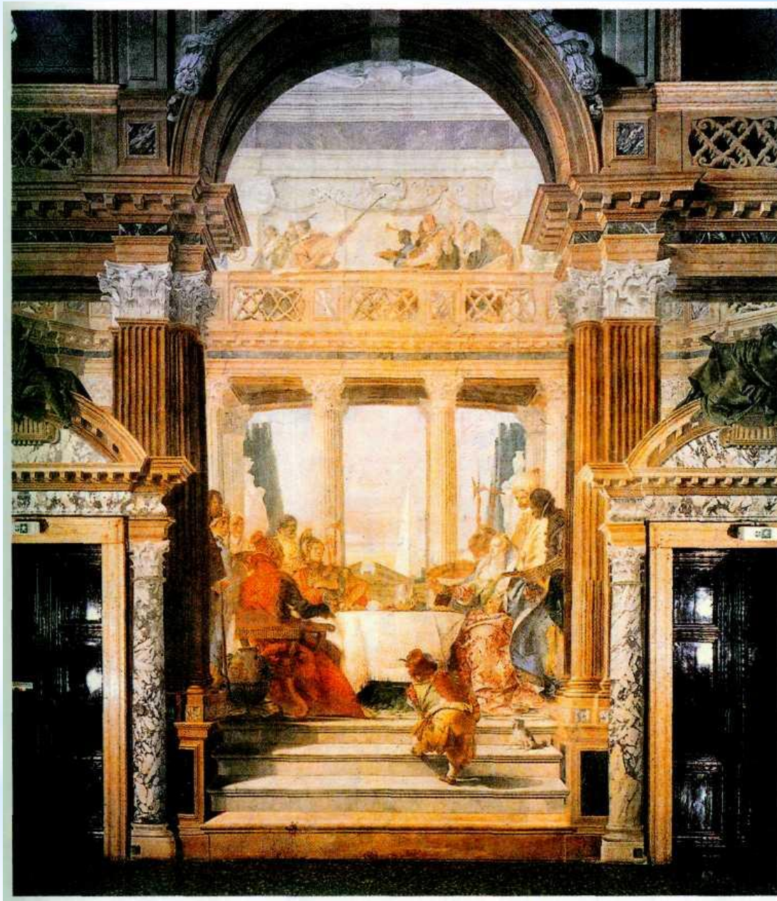
* Встреча Антония и Клеопатры