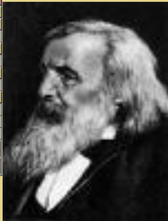
Д. И. Менделеев русский ХИМИК