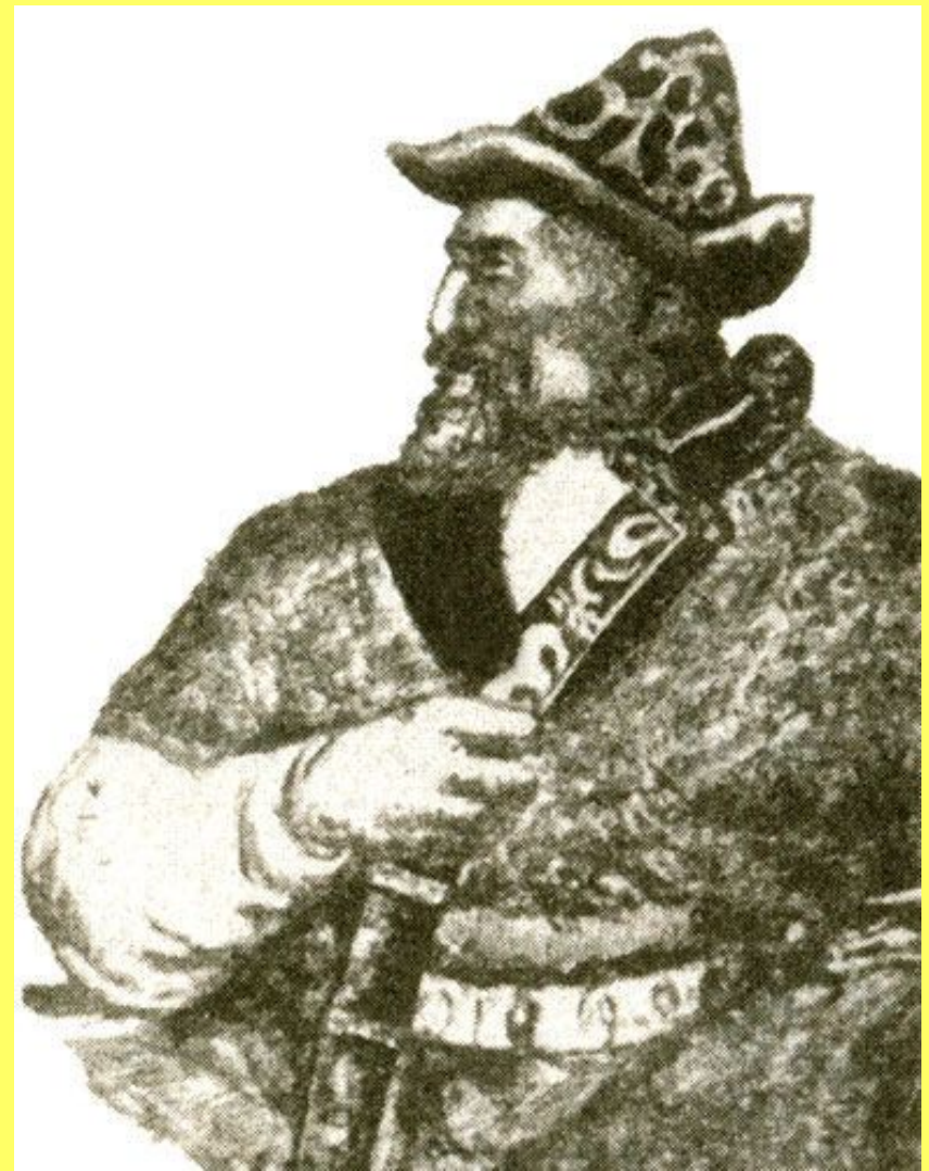
Реальное фото Кенесары