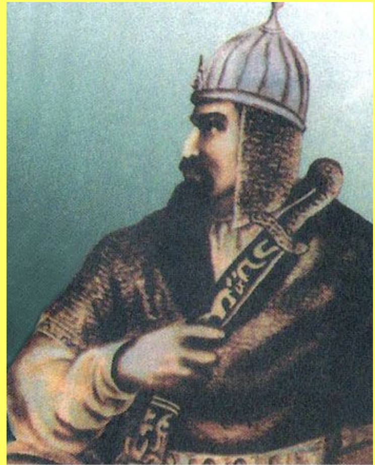
Кенесары хан (1802 - 1847)

1841 г. – представители трех жузов избрали Кенесары своим ханом. 1844г. – Кенесары признан в качестве хана всеми правителями государств Средней Азии.