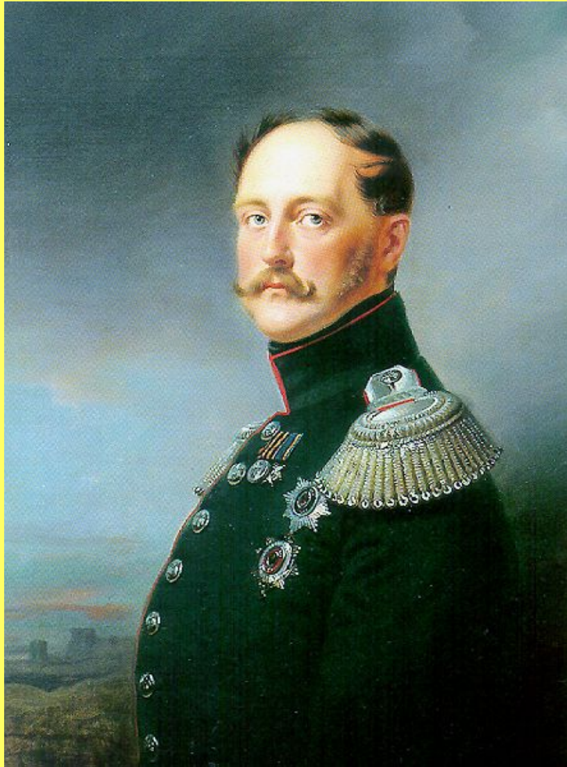
Никола́й I Па́влович — император Всероссийский с 14 декабря 1825 по 18 февраля 1855