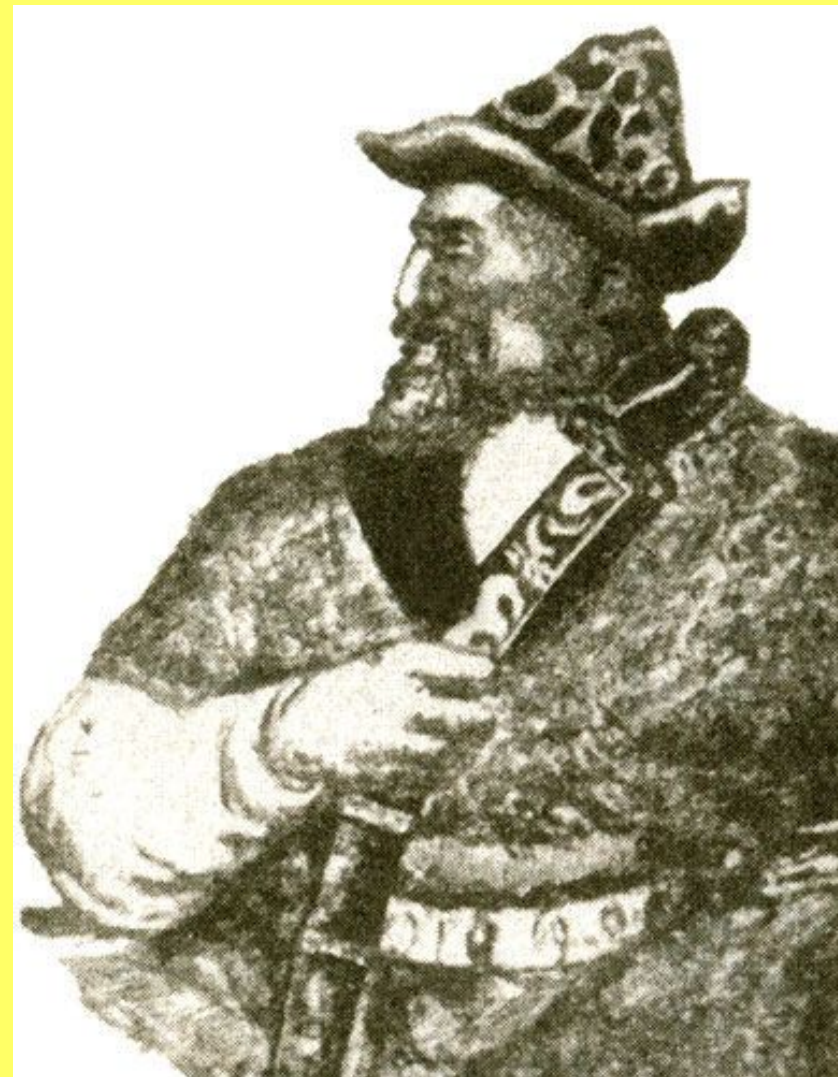
Реальное фото Кенесары