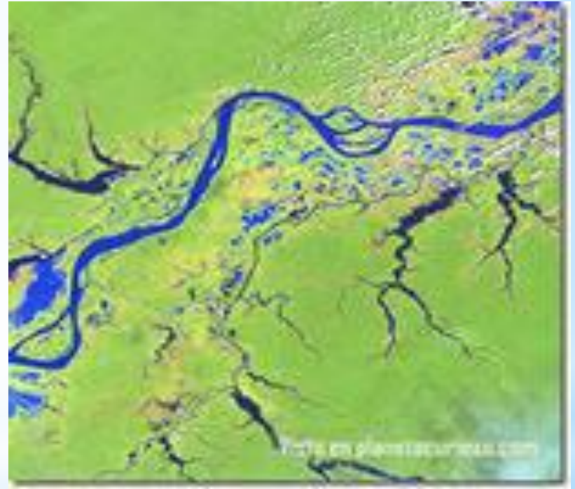
Дельта р. Амазонка