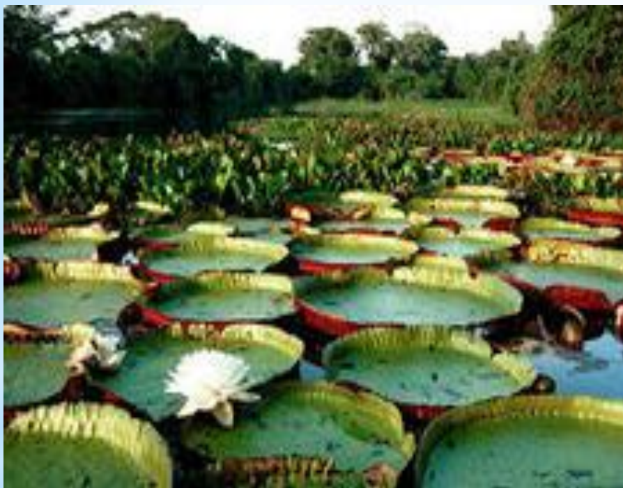
ГИГАНСКИЕ КУВШИНКИ АМАЗОНИИ