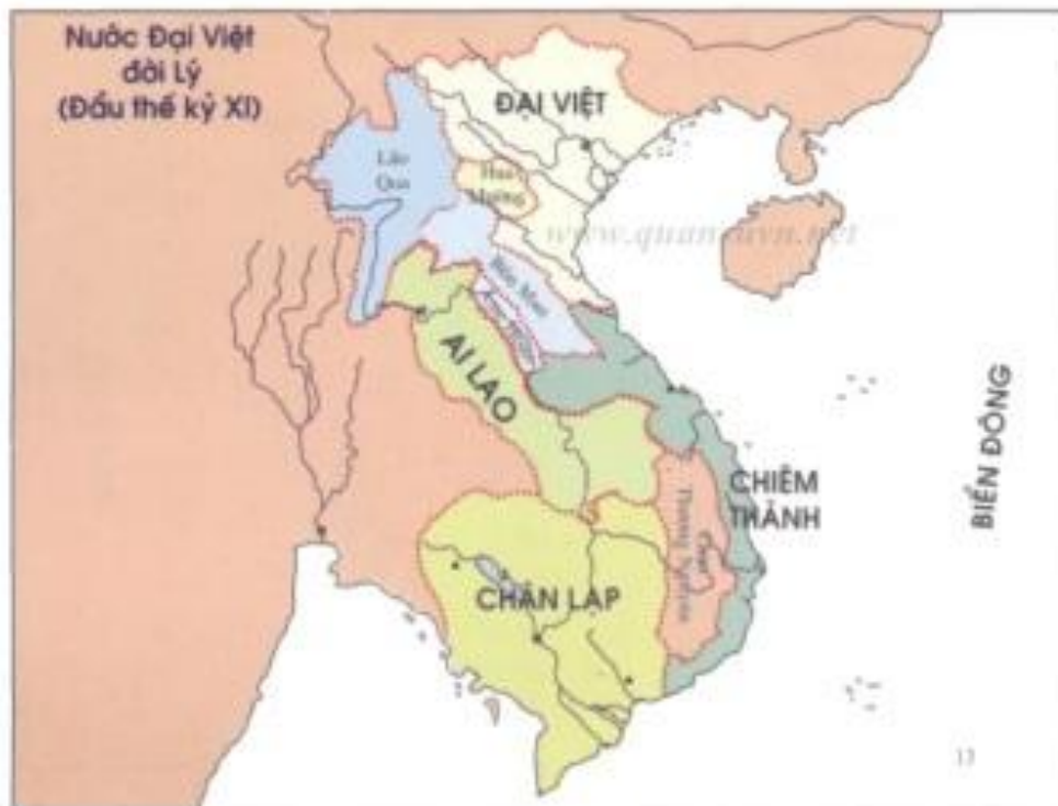
Hình 5. Đại Việt triều Lý

• В 880 году китайские войска покинули своё южное вьетское наместничество Аннам дохофу. В 939 году Нго Кюйен победил китайцев, пытавшихся влиять на вьетов, и основал династию Нго, которая пала в 961 году. В 968 году эта территория была объединена Динь Бо Линем под именем Дайковьет — Великий древний Вьет.