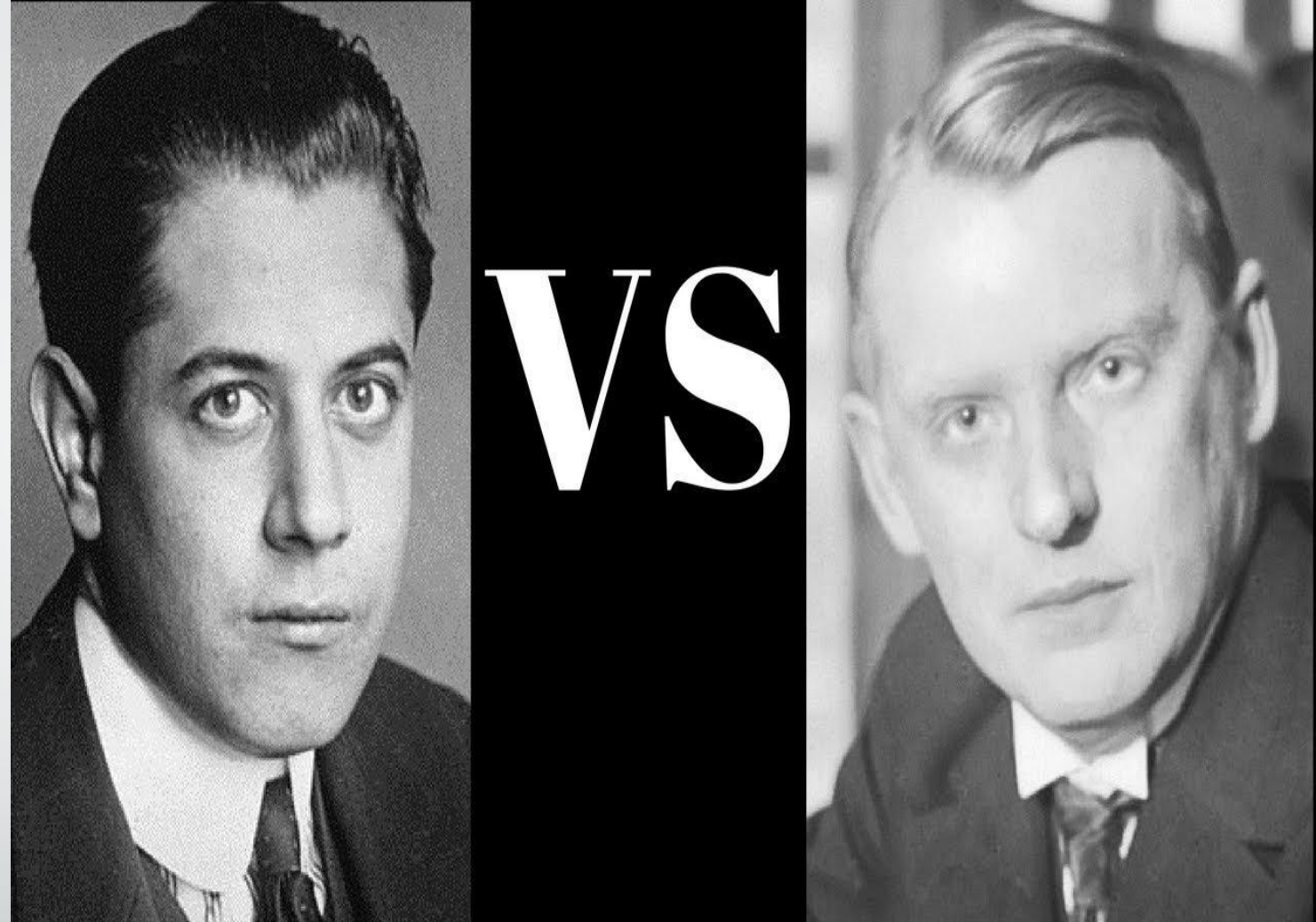
Хосе Рауль Капабланка и Александр Алёхин

Матч проходил в Буэнос-Айресе в 1927-м году и стоил Алехину 10000$ согласно правилам Лондонского протокола .