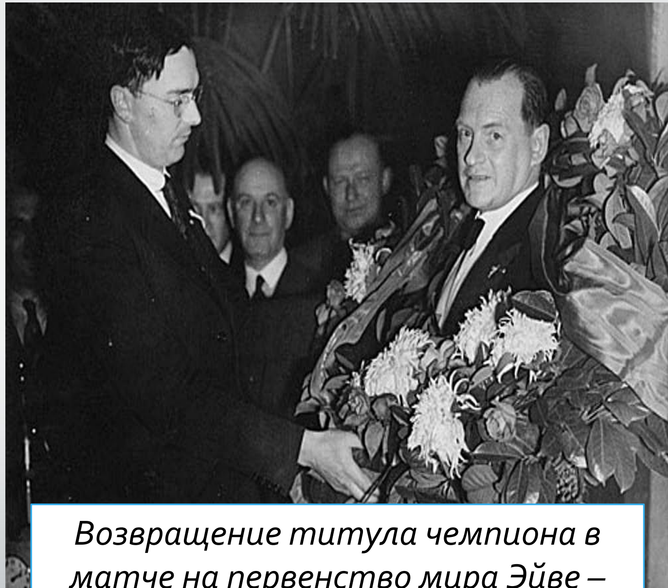
Возвращение титула чемпиона в матче на первенство мира Эйве – Алехин 1936 г.

И до сих пор этот случай является единственным случаем, когда шахматист выиграл в результате матча-реванша.