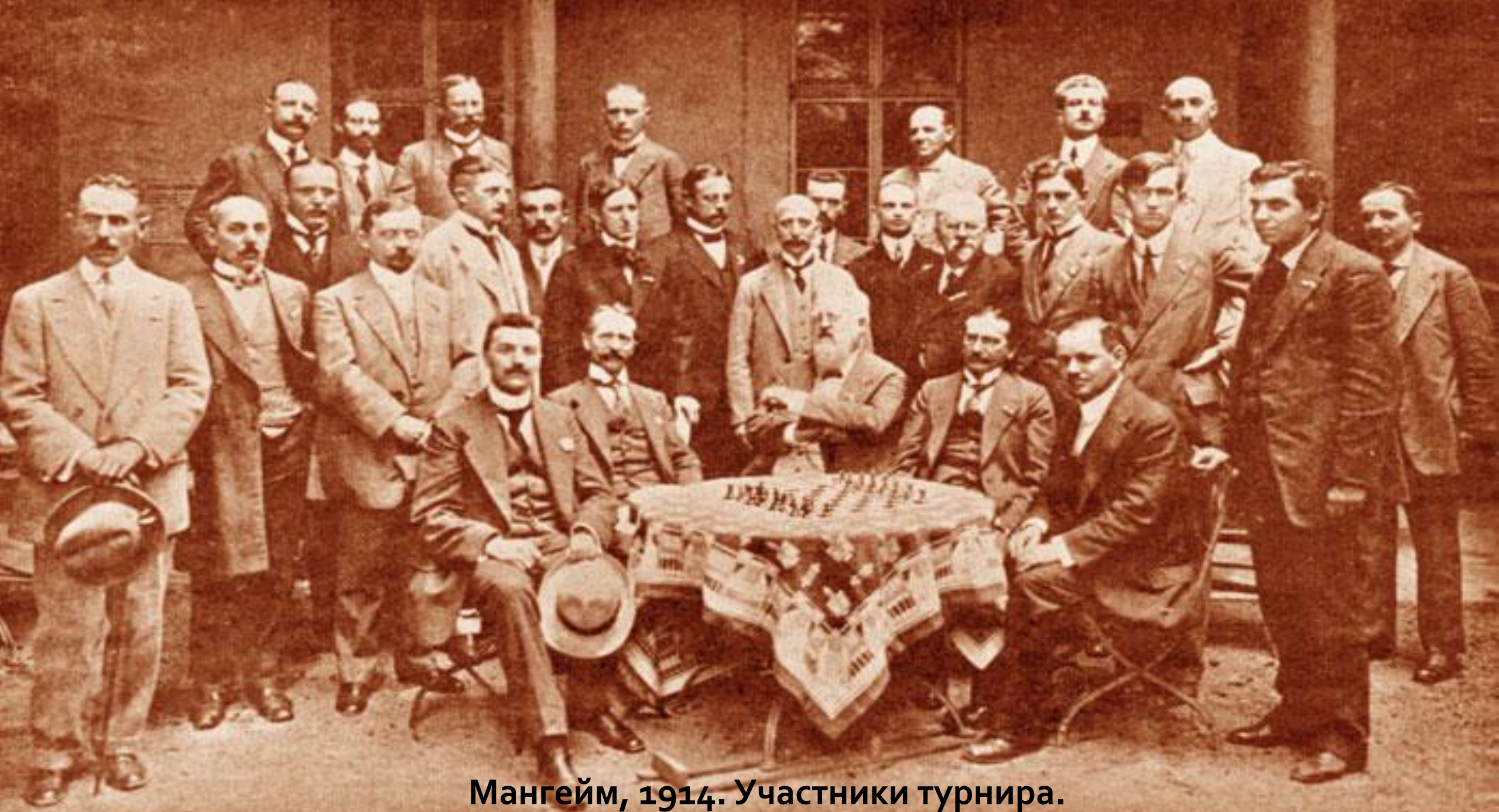
Мангейм, 1914. Участники турнира.