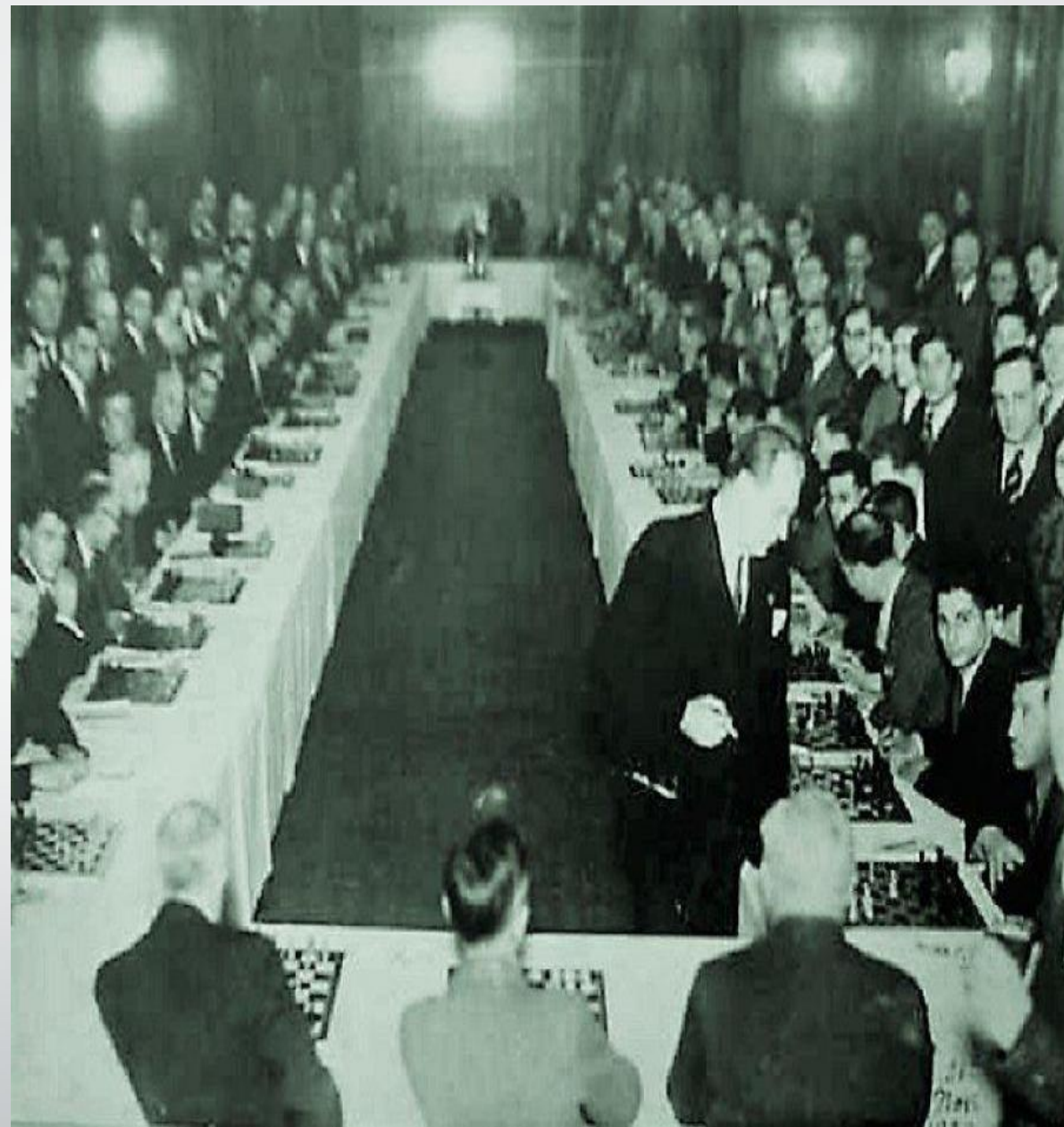
Сеанс одновременной игры

Также Алехин выступает организатором многих чемпионских матчей, оплачивая организаторские расходы и присуждая призовые фонды. Для того чтобы собрать нужные суммы, он устраивает "слепые" матчи в Нью-Йорке и Париже, организовывает шахматные баталии и играет в сеансах одновременной игры.