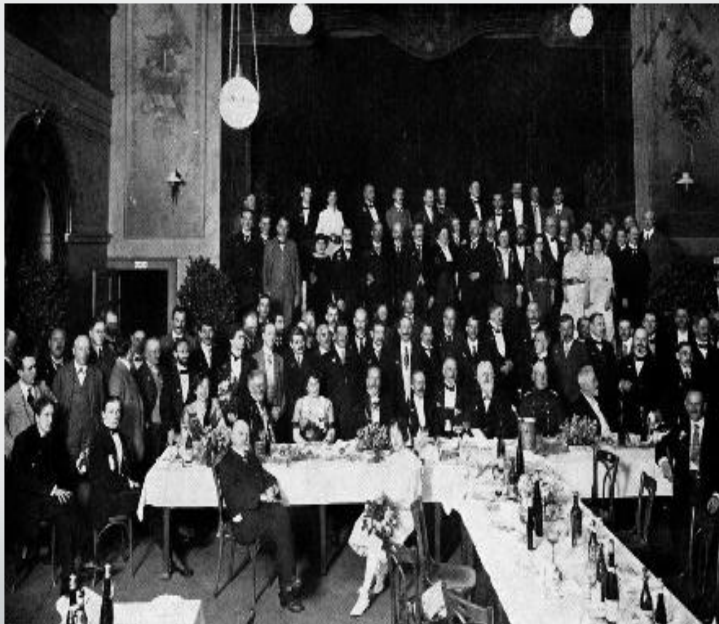
Праздничный банкет к открытию Международного шахматного турнира , 19 июля 1914 г

20 октября он принял участие в сеансе одновременной игры в Стокгольме, и все заработанные деньги отдал русским шахматистам в немецком плену.