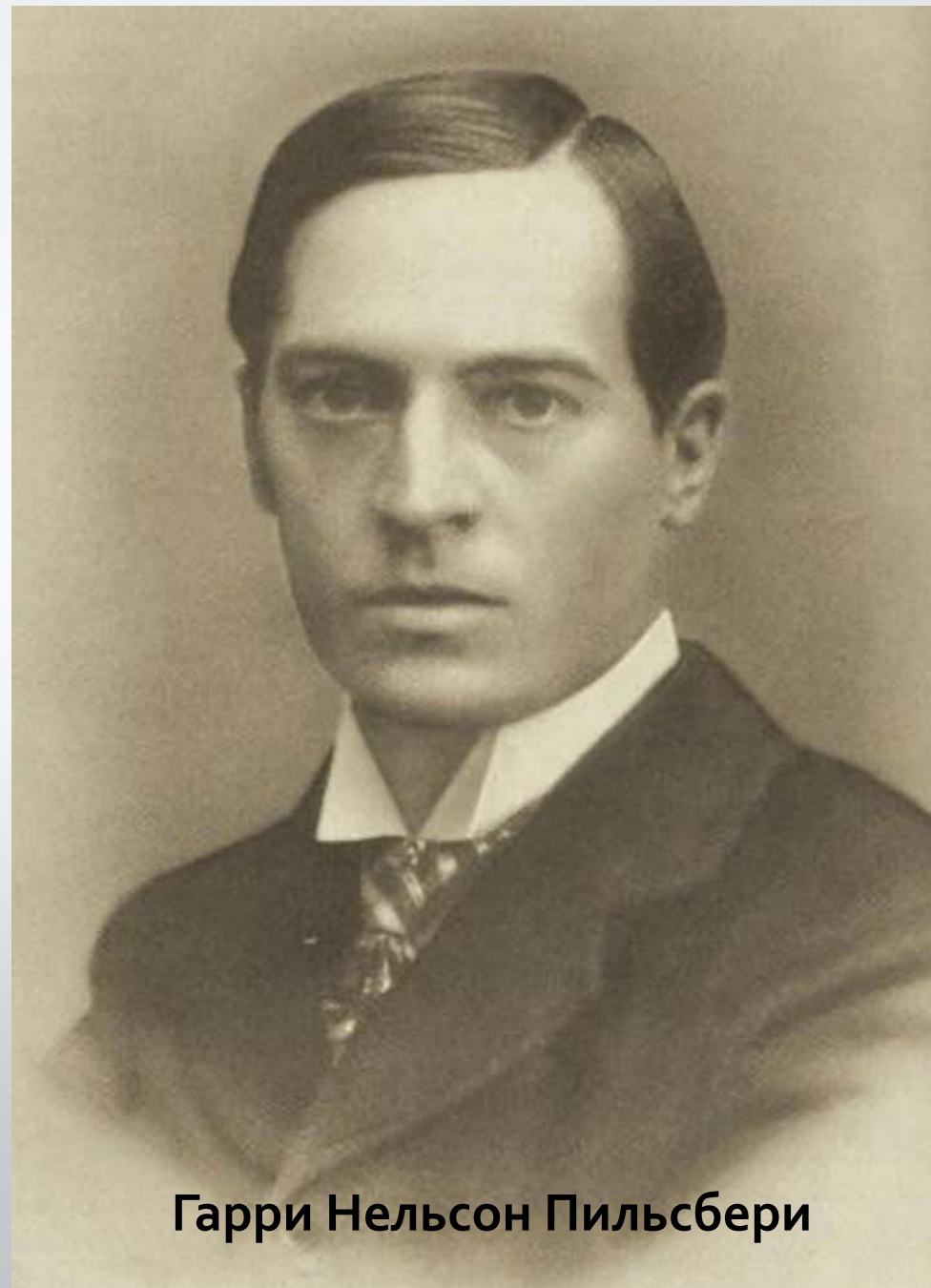
Гарри Нельсон Пильсбери

Алехин свел свою партию вничью, но проникся восхищением к мастеру. Он тоже захотел стать шахматным маэстро.