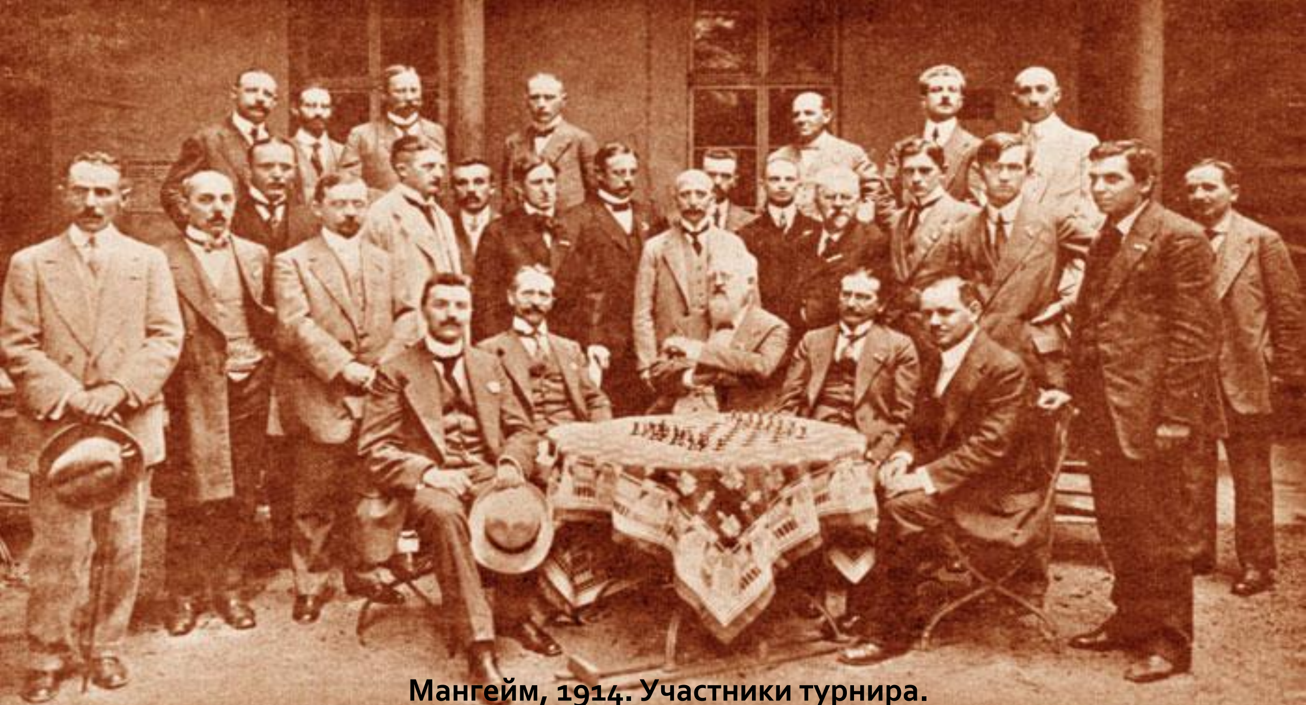
Мангейм, 1914. Участники турнира.