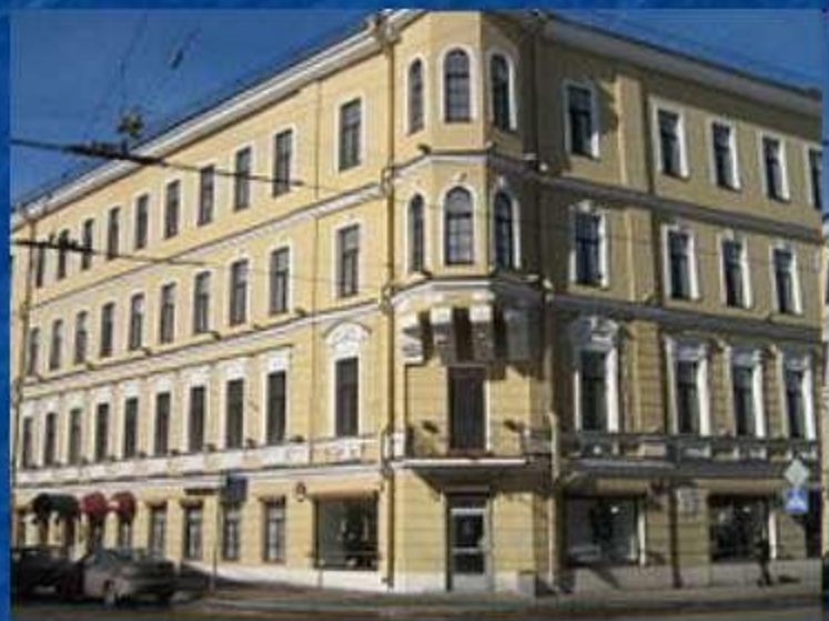
Старо-Петергофский проспект, д. 19