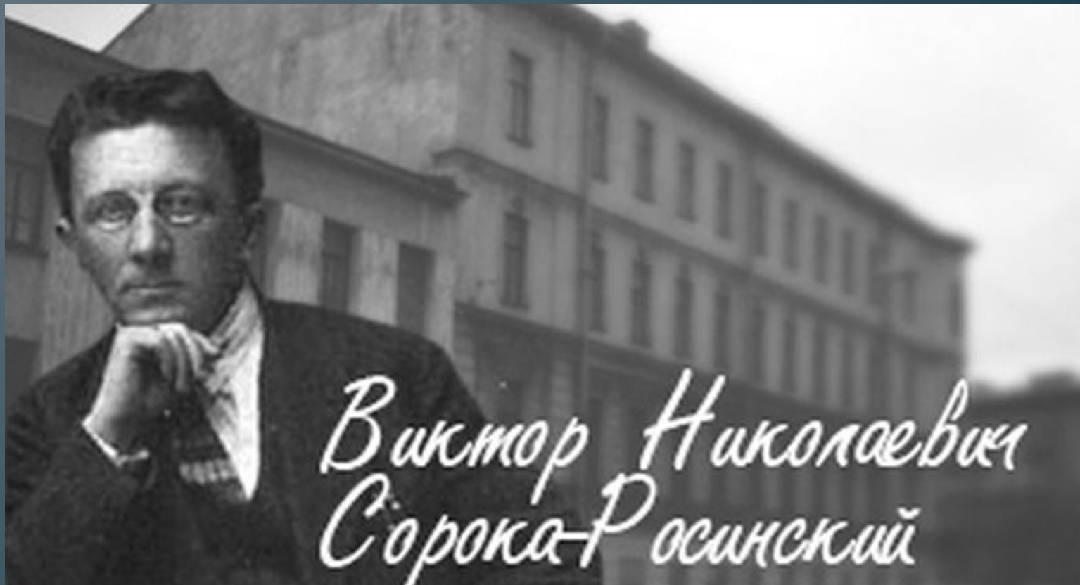
Виктор Николаевич Сорока-Росинский