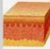
Схема заживления раны первичным натяжением без образования рубца