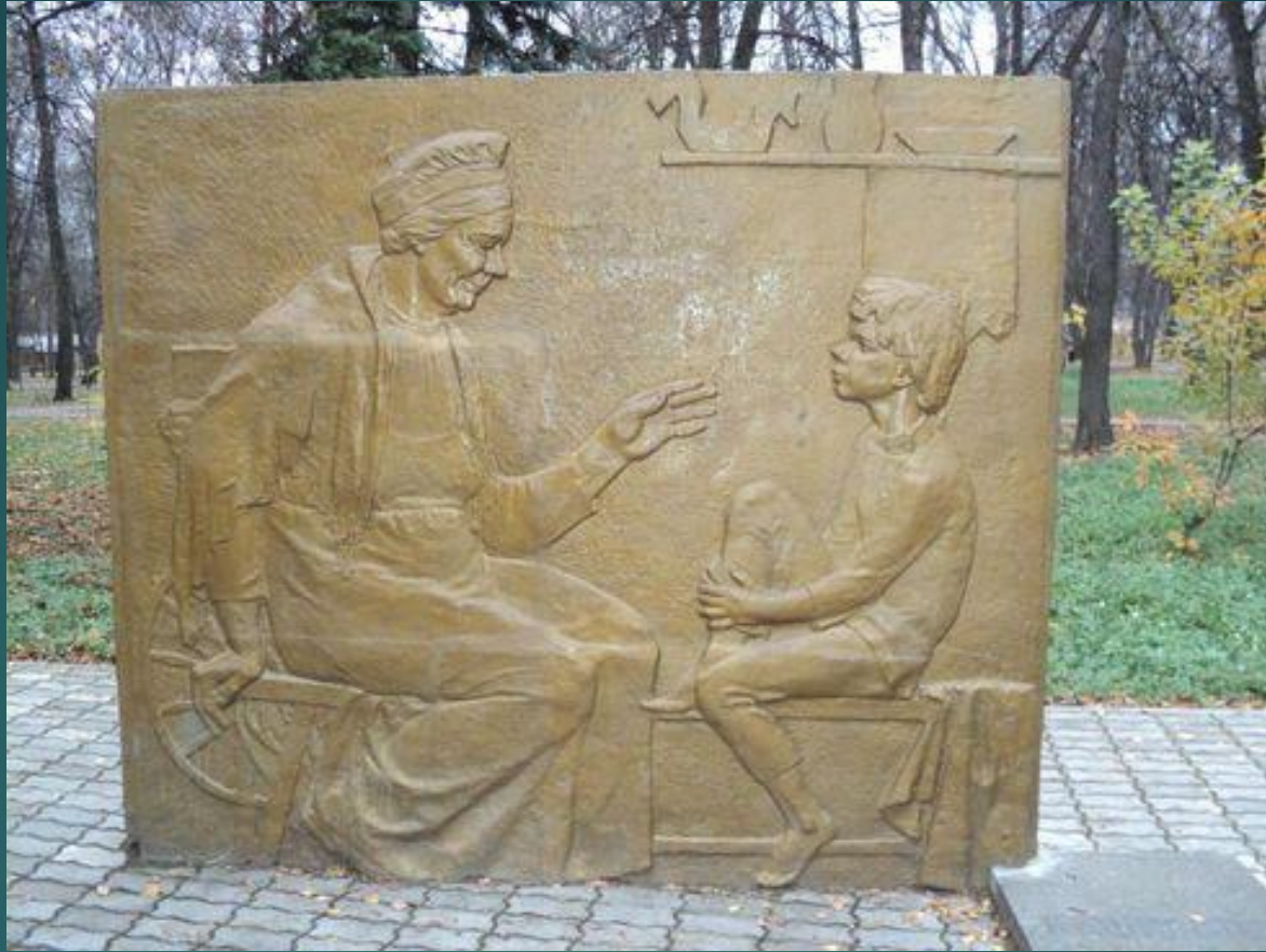
Памятник Кашириной Акулине Ивановне в Нижнем Новгороде.