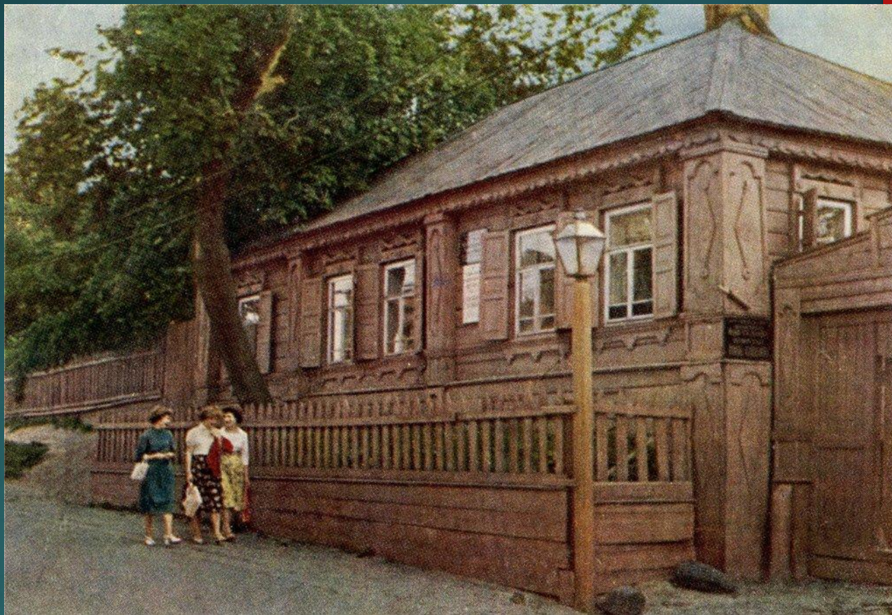
Домик Каширина, где провел детство А. М. Горький.