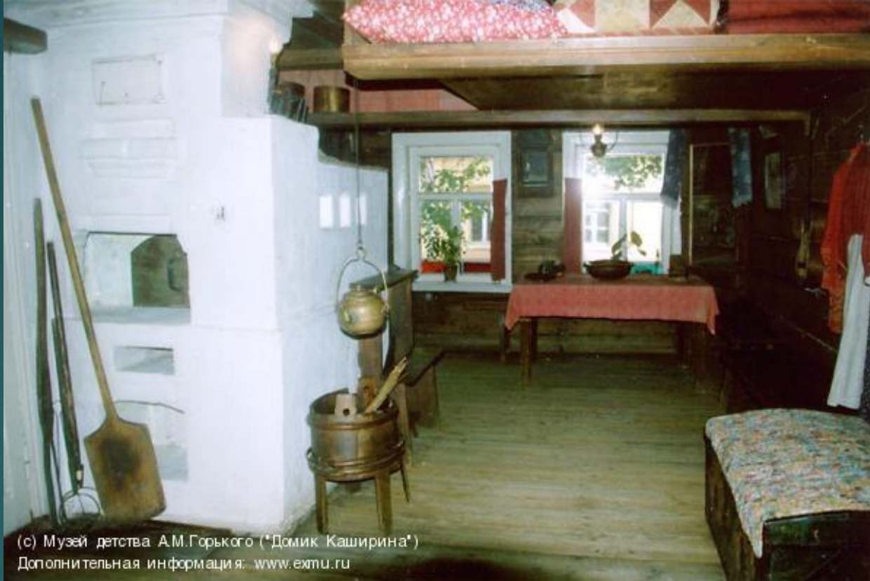
Дополнительная информация: www.ехтп.гу