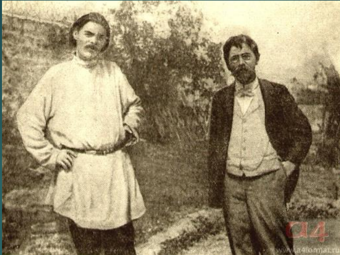
А. П. Чехов и М. Горький в саду на даче Чехова в Ялте.