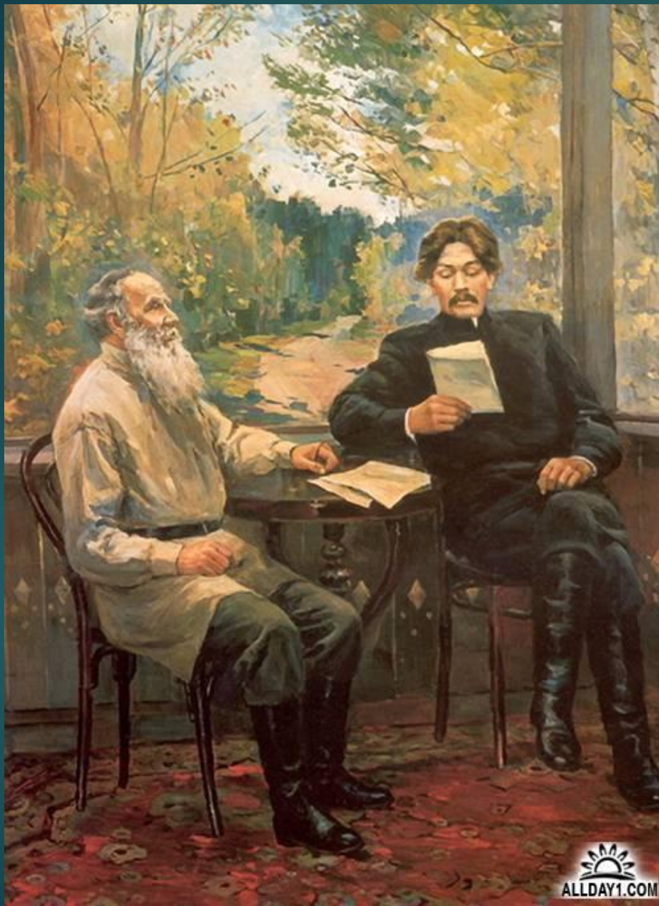
А.М.Горький и Л.Н. Толстой в Ясной поляне.