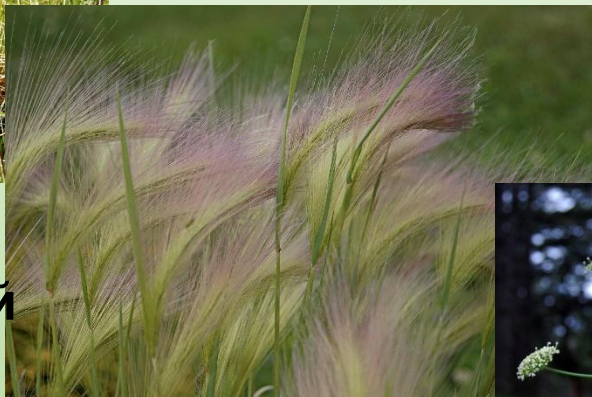
КОВЫЛЬ НЕСКОЛЬКО ВИДОВ