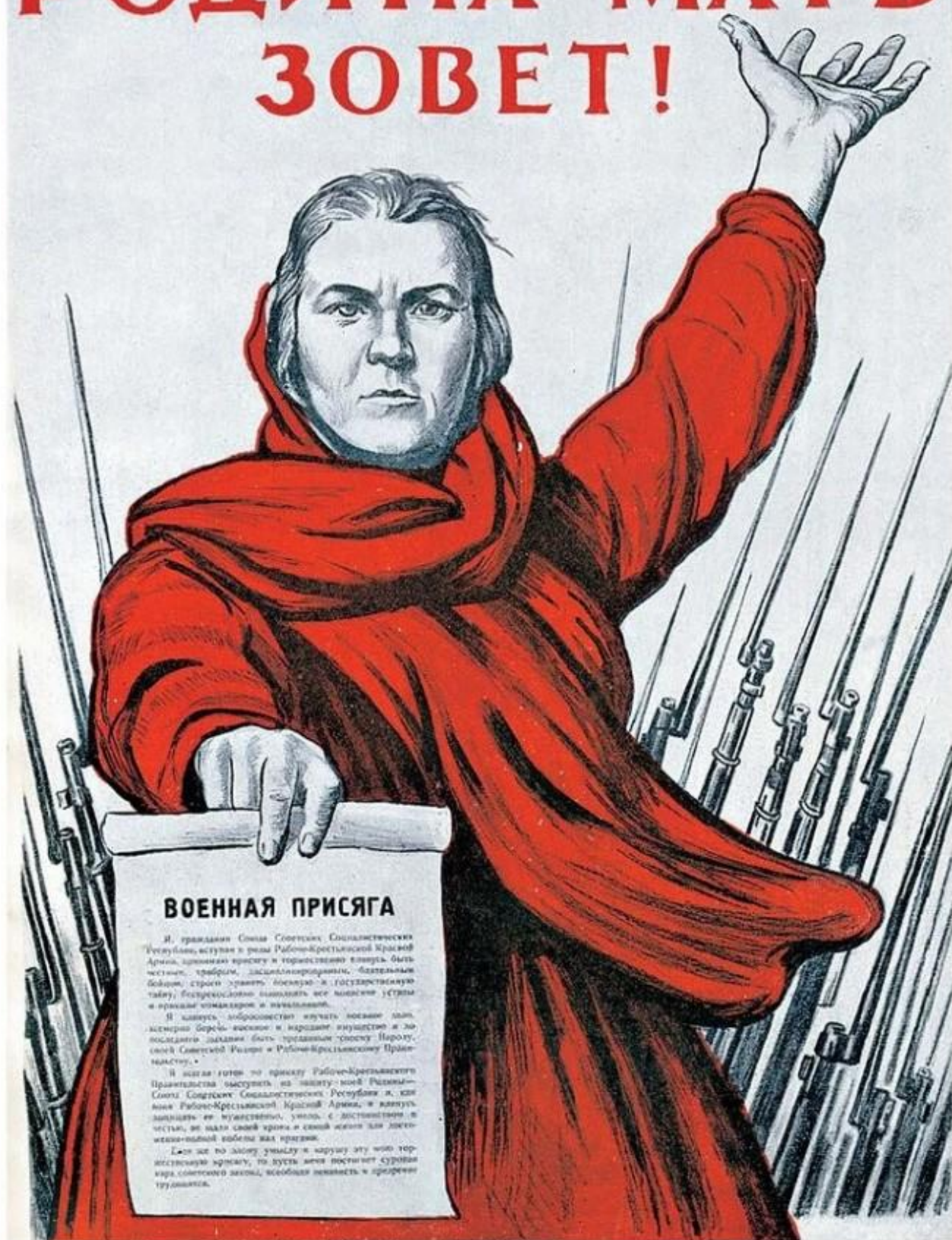
Плакат «Родина-мать зовет!» Художник И.М. Тоидзе. 1941 г.