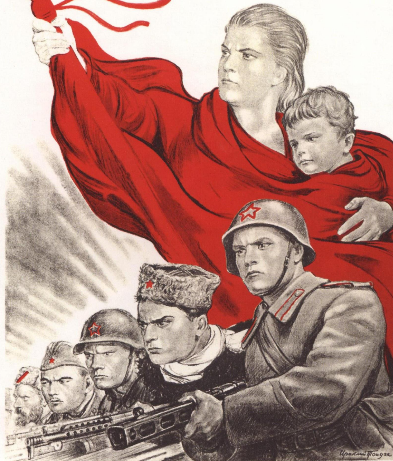
295. Тоидзе И. За Родину-мать! 1943