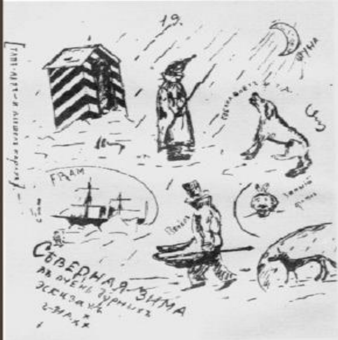
Северная зима. Рисунок А. Блока из рукописного журнала «Вестник». По словам М. А. Бекетовой, это интересно сопоставить с мотивными поэмы «Двенадцать».