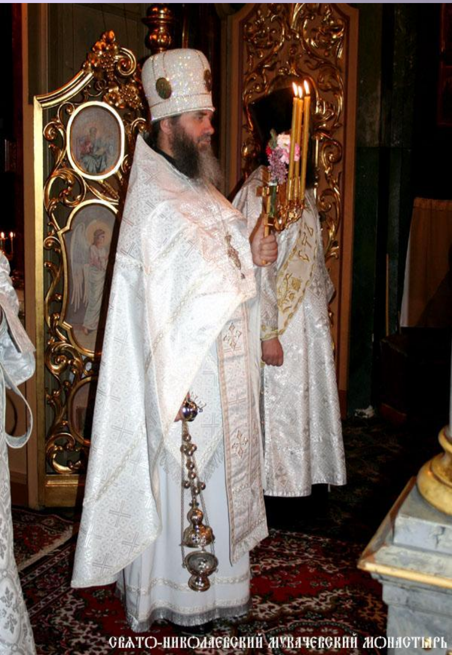
СВЯТО-НИКОЛАЕВСКИЙ МУЖАЧЬЕВСКИЙ МОНАСТЫРЬ