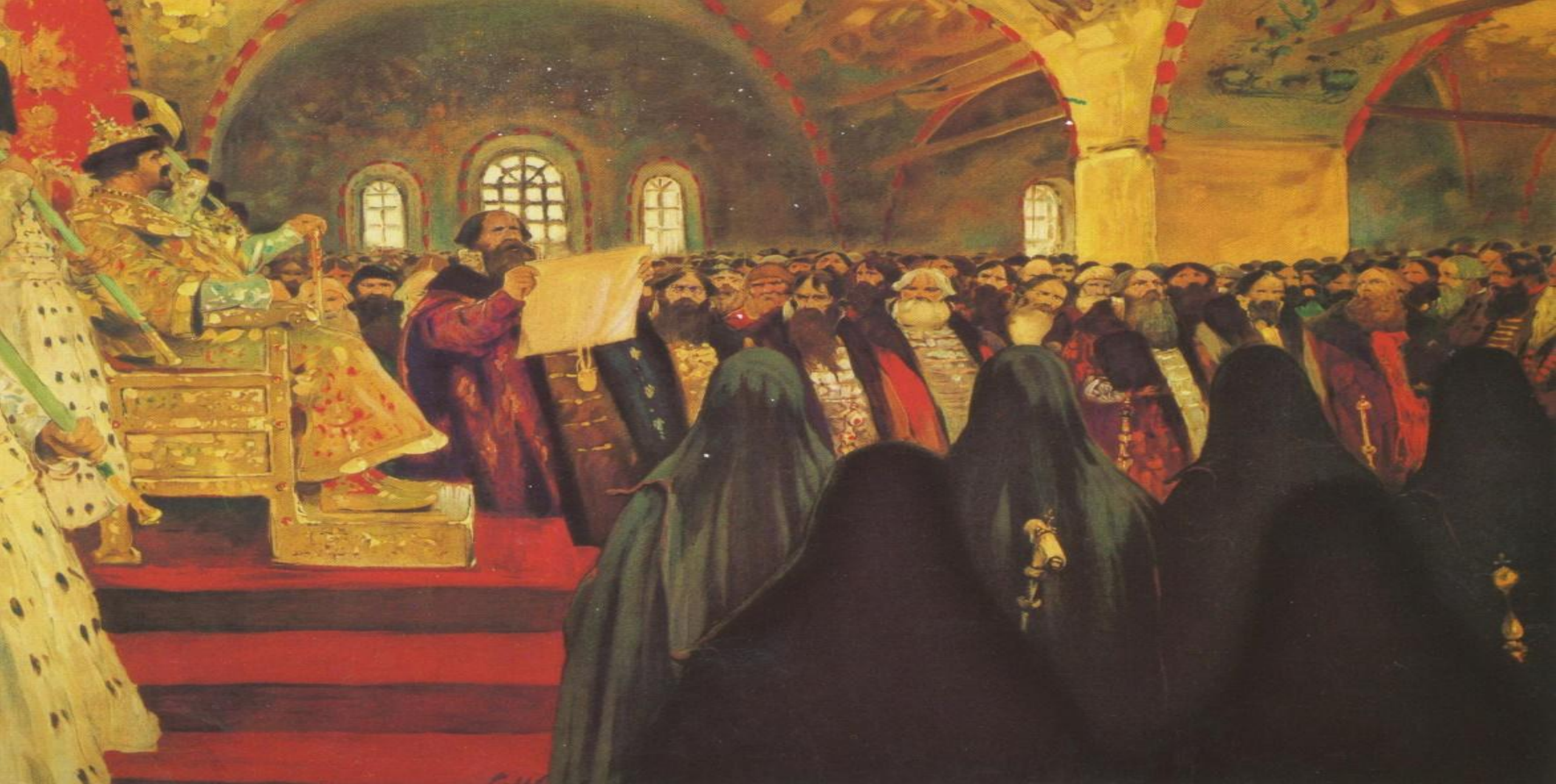
Земский собор (1549) — высшее сословно-представительское учреждение Русского царства с середины XVI до конца XVII века, собрание представителей всех слоёв населения (кроме крепостных крестьян) для обсуждения политических, экономических и административных вопросов.