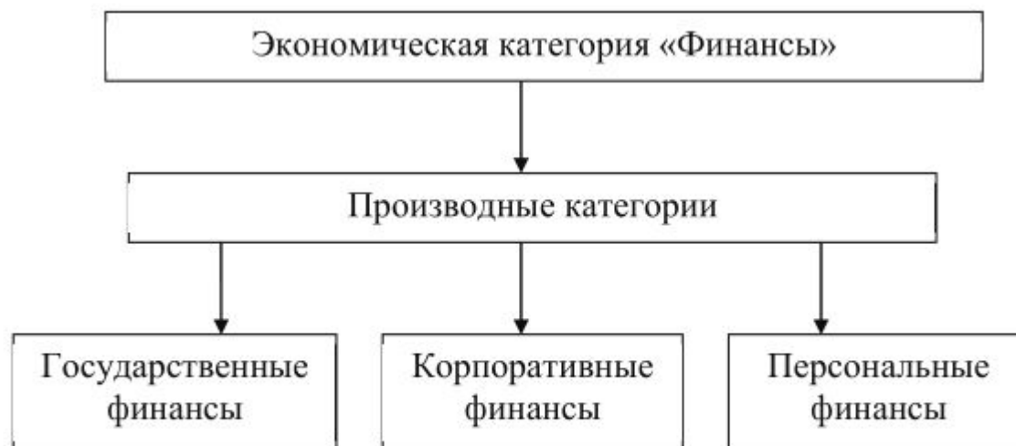
Рис. 1. Структура категории «финансы»

Государственные финансы выступают категорией, опосредующей экономические отношения между государственным, корпоративным сектором и отдельными гражданами (рис. 1).