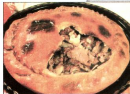
Зур балиш — татарский пирог