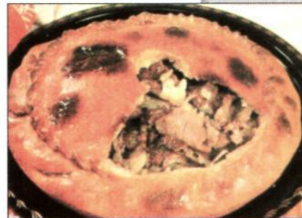
Зур балиш — татарский пирог