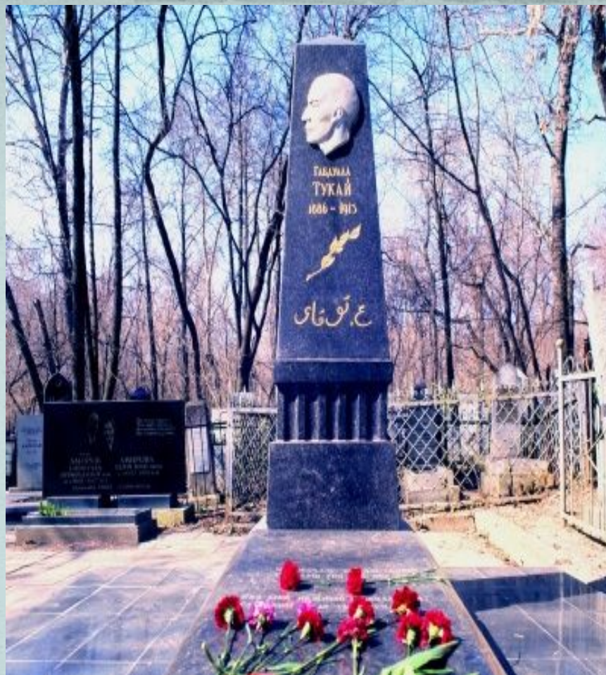
Габдулла Тукай кабере өстендә һәйкәл