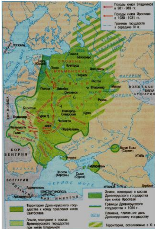
Русь в годы раздробленности