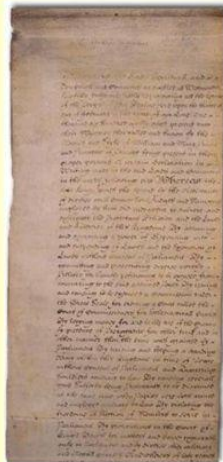
Билль о правах 1689 года.

В Англии установилась конституционная монархия