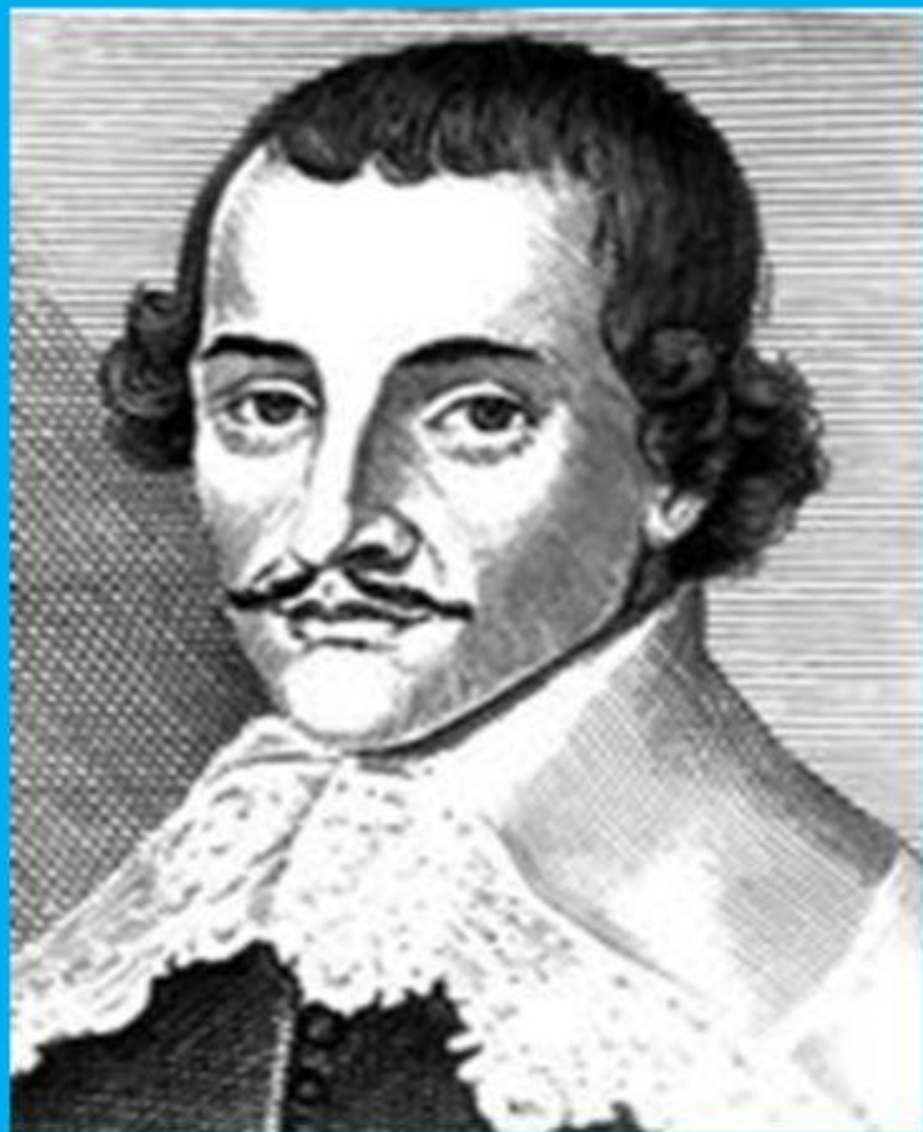
Джон Лильберн – левеллеры