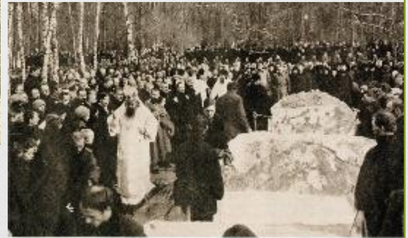
Первое погребение на Московском городском Братском кладбище.