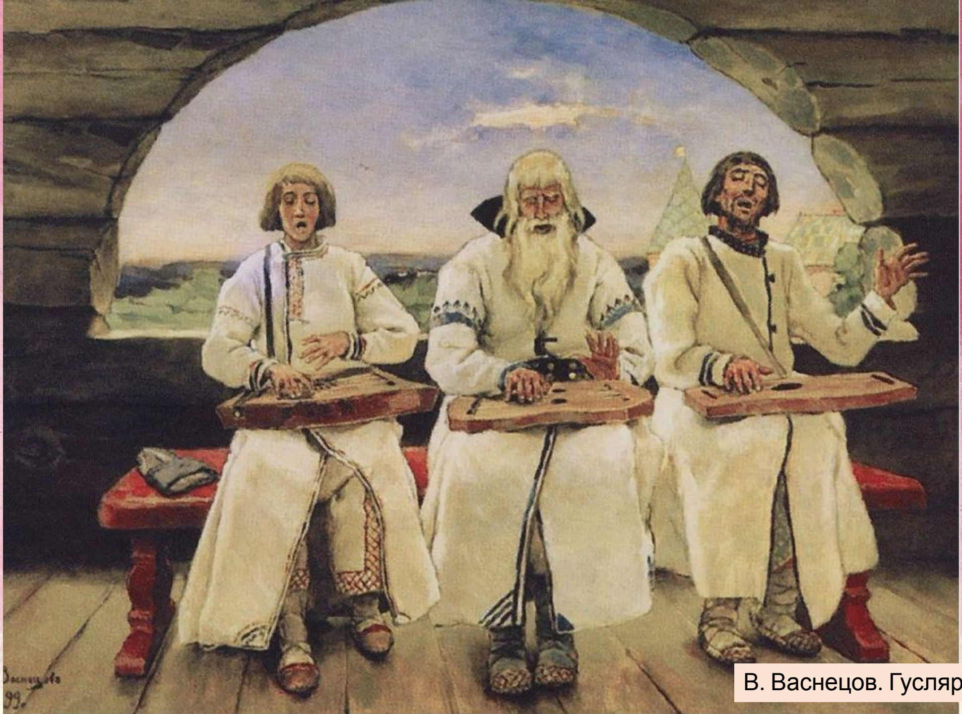
В. Васнецов. Гуслиеры