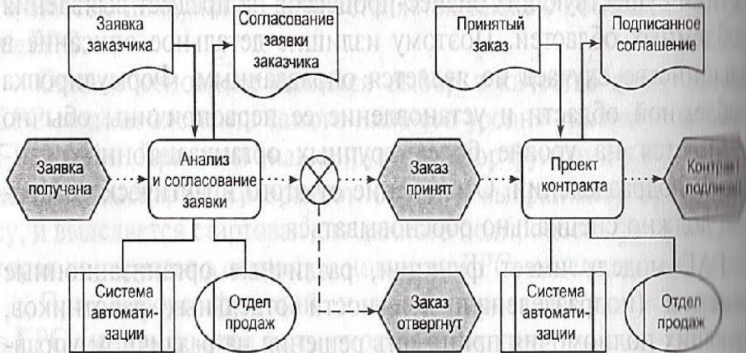
Рис. 3.20. Пример описания бизнес-процесса на поставку продукции клиенту в нотации ARIS (см. также рис. 3.12)