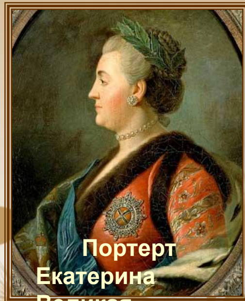
Портрет Екатерина Великая