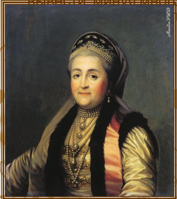
А. Д. Р. К. О.

□ Обычно (за исключением короткого периода в 1778—1780 годах, когда ей было под пятьдесят, и она за короткий срок сменила несколько любовников) со своими фаворитами Екатерина проводила по несколько лет, расставаясь с ними обычно из-за несовместимости характеров, плохого образования фаворитов, их измен или недостойного поведения. Сохранившаяся переписка Екатерины с любовниками выдает «её безудержную чувственность», но «насколько нам известно, она никогда не вступала в связь без любви. Нет никаких свидетельств тому, что она когда-либо приближала к себе мужчину, не веря, что вступает в долгие и серьёзные отношения». Вероятно, случались и «переходные случаи» и «одноночные свидания» в поисках подходящего спутника, однако они были неизбежно редки, поскольку во дворец практически невозможно было кого-нибудь ввести и