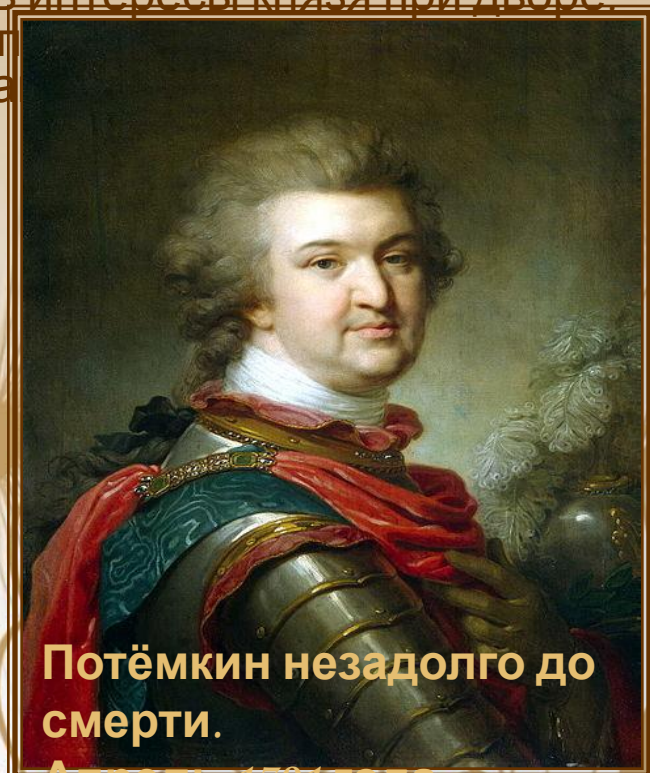
Потёмкин незадолго до смерти.