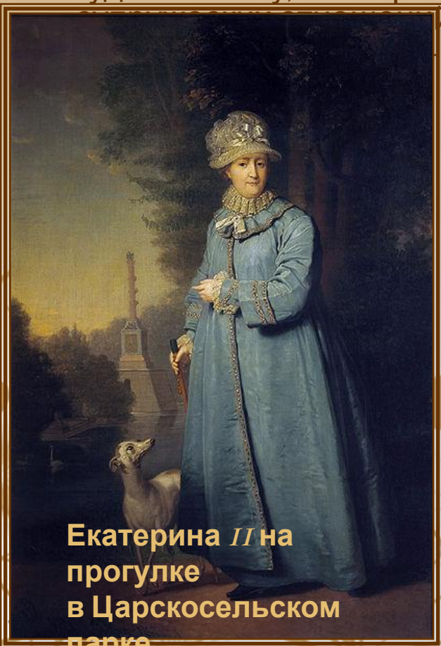
Екатерина II на прогулке в Царскомельском парке