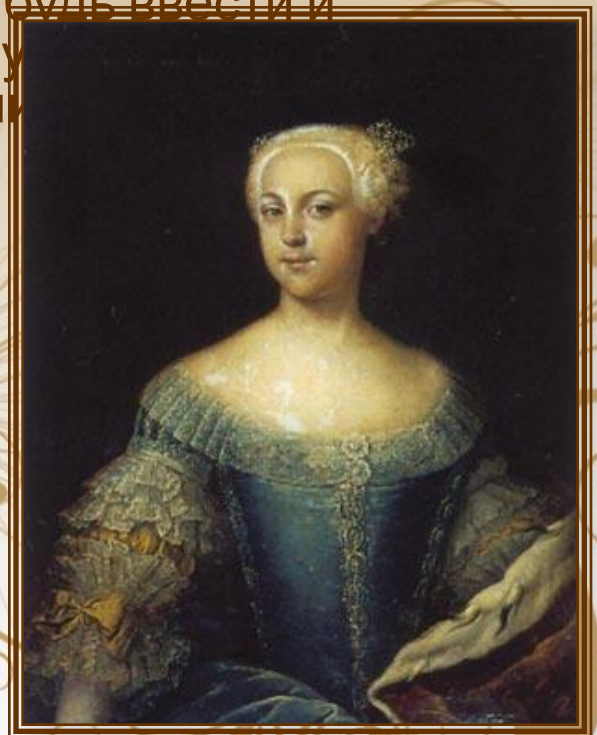
Екатерина II Неизвестный художник.

подмечали Гримо де ла Турвилль и Фредерика Августа. 1742г. (На этом портрете будущей Екатерине Великой 13 лет.)