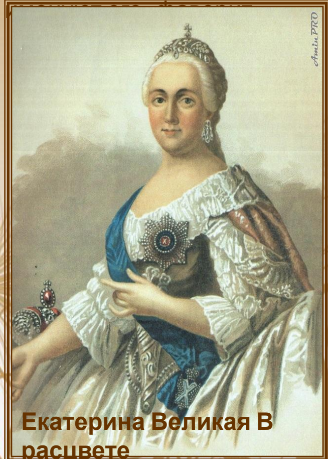
Екатерина Великая В расцвете