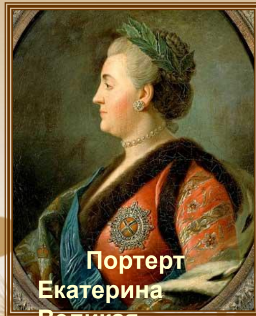
Портрет Екатерина Великая