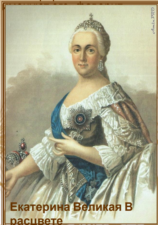
Екатерина Великая В расцвете