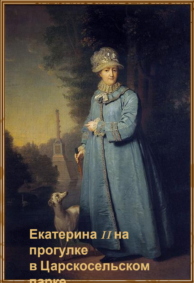
Екатерина II на прогулке в Царскомельском парке