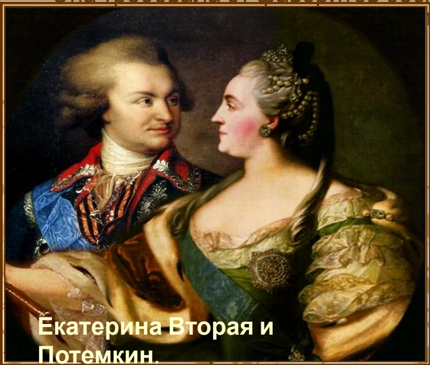
Екатерина Вторая и Потемкин.