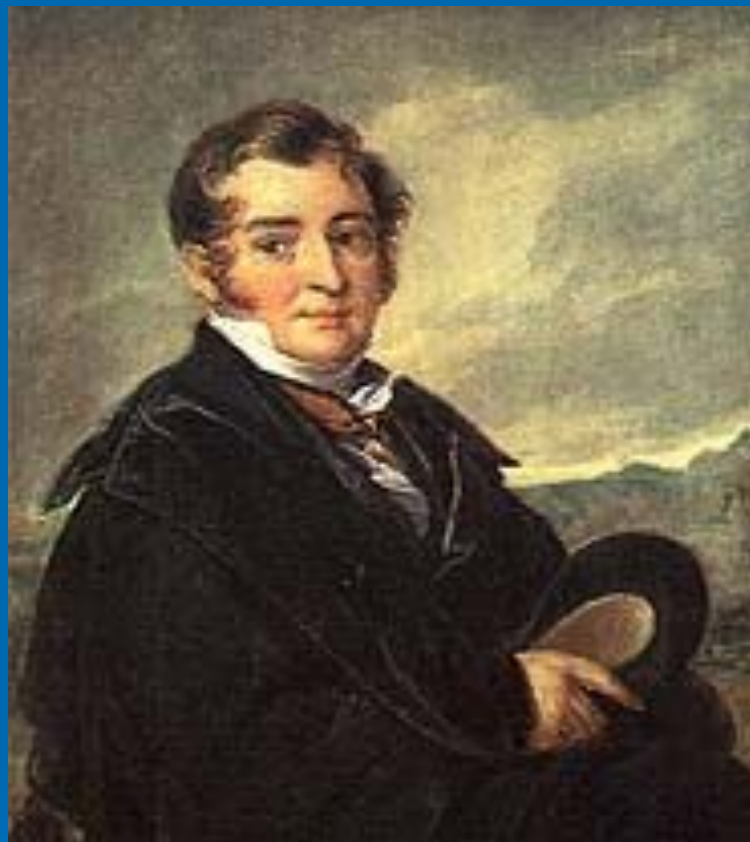
В. А. Тропинин. «Портрет неизвестного из семьи Голицыных». Этюд, 1820-е годы.