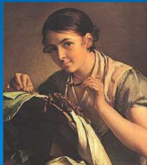
В. А. Тропинин. «Кружевница». 1823 год. Третьяковская галерея.

В портретах 1830-40-х годов возрастает роль выразительной детали, в ряде случаев — пейзажного фона, усложняется композиция, напряженной и экспрессивней становится колорит. Романтическая атмосфера, стихия творчества, предстает еще более наглядной в портрете «К. П. Брюллова» (1836, Третьяковская галерея) и автопортрете 1846 года (там же), где художник представил себя на эффектном историческом фоне Московского Кремля. При этом романтизм художника, не возносясь в эмпирию, обычно остается камерным и умиротворенно-«домашним» — даже там, где очевиден намек на сильное чувство, эротический мотив («Женщина в окне», чей образ был навеян поэмой М. Ю. Лермонтова «Тамбовская казначейша», 1841, там же). Поздние произведения Тропинина (например, «Слуга со штофом, считающий деньги», 1850-е гг., там же) свидетельствуют об угасании колористического мастерства, однако по-прежнему привлекают своей жанровой наблюдательностью, предвосхищающей страстный интерес к бытописанию, свойственный русской живописи 1860-х гг..