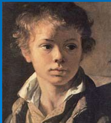
«Портрет А. В. Тропинина» (сына художника). Около 1818 года. Третьяковская галерея.

ТРОПИНИН Василий Андреевич [19 (30) марта 1776, с. Карповка Новгородской губернии — 4 (16) мая 1857, Москва], русский художник. Один из основоположников романтизма в живописи России. Родился в семье крепостных. Был крепостным сначала графа А. С. Миниха, затем И. И. Моркова. В 1798-1804 учился в петербургской Академии художеств, где сблизился с О. А. Кипренским и А. Г. Варнеком (последний тоже стал впоследствии видным мастером русского романтизма). В 1804 Морков вызвал молодого художника к себе; затем тот попеременно жил то на Украине, в селе Кукавка, то в Москве, на положении крепостного живописца, обязанного одновременно выполнять хозяйственные поручения помещика. Лишь в 1823 был окончательно освобожден от крепостной зависимости. Получил звание академика, но, отказавшись от карьеры в Петербурге, в 1824 поселился в Москве.