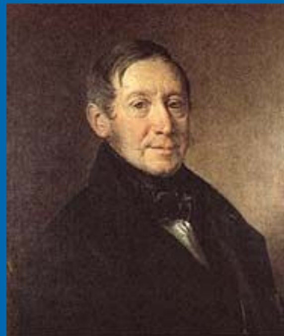
Архитектор К. А. Тон. Портрет работы В. А. Тропинина.