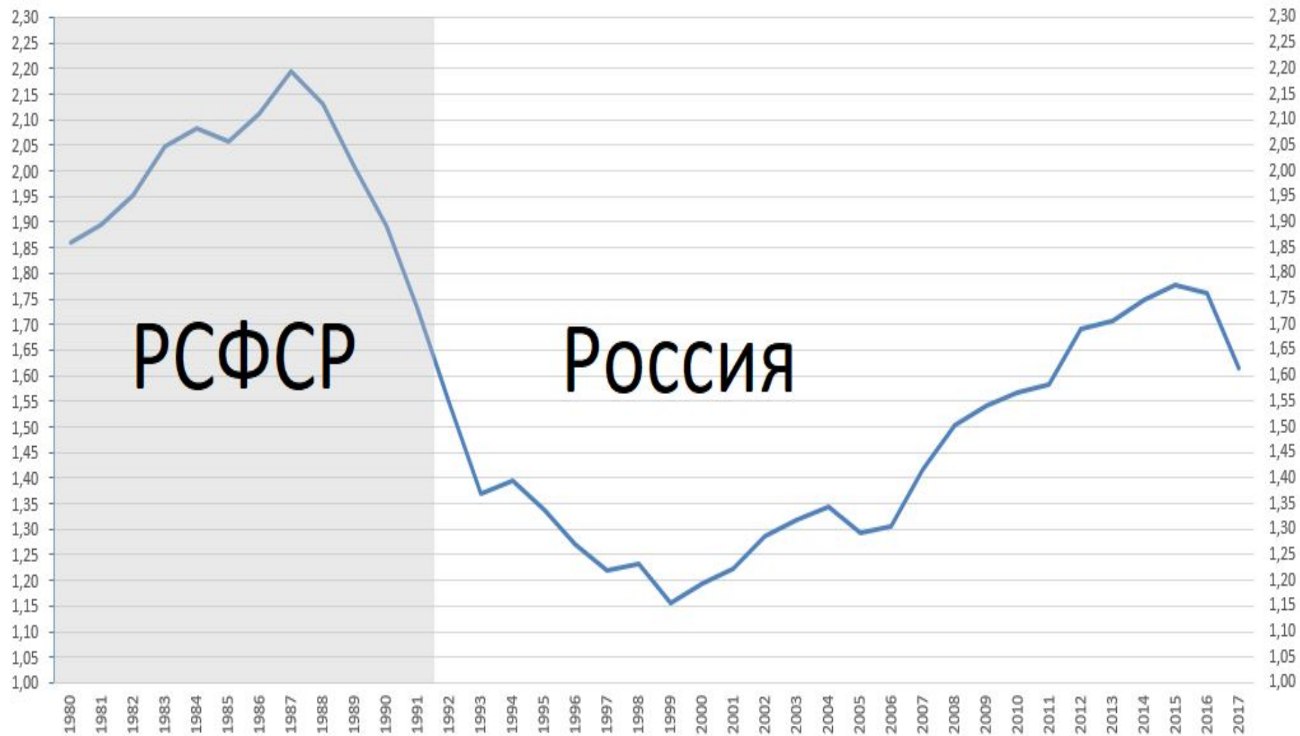
Суммарный коэффициент рождаемости в РСФСР и России, 1980-2017 гг.