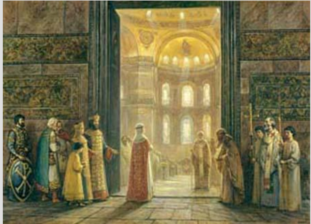
Крещение Ольги. При крещении имя – Елена.