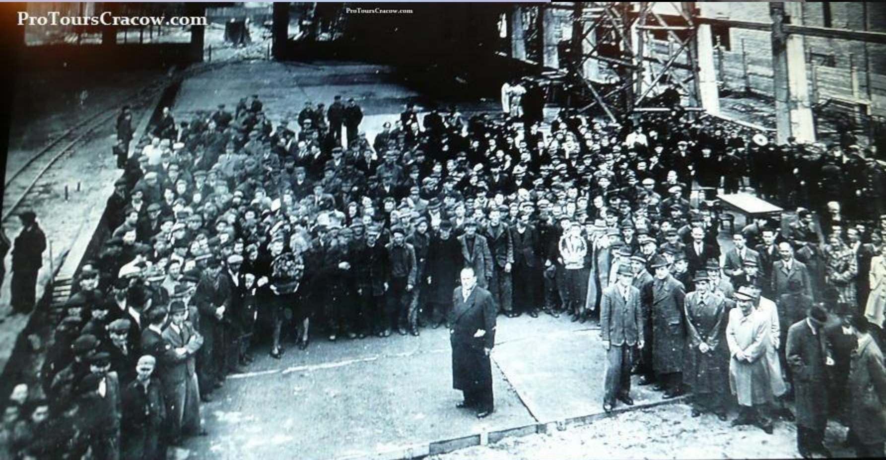
Oskar Schindler i jego pracownicy (więźniowie obozu pracy Brünnlitz), 1945