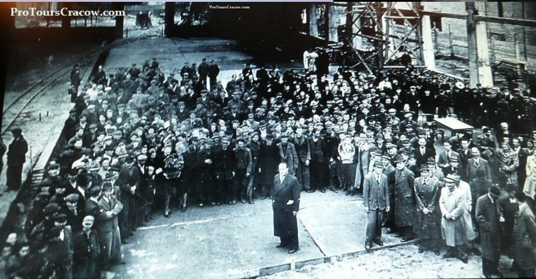
Oskar Schindler i jego pracownicy (więźniowie obozu pracy Brünnlitz), 1945