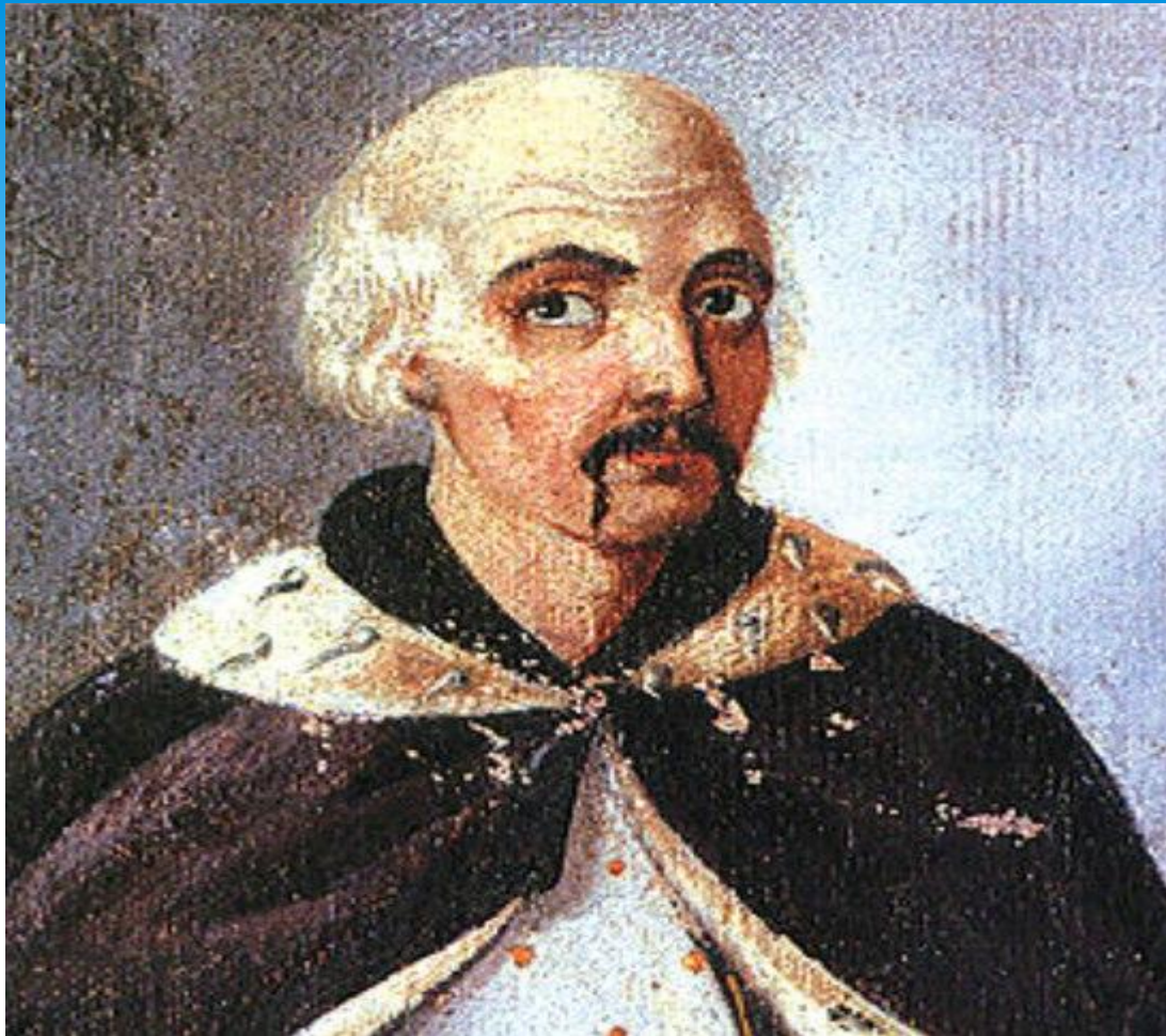
* Северин Наливайко