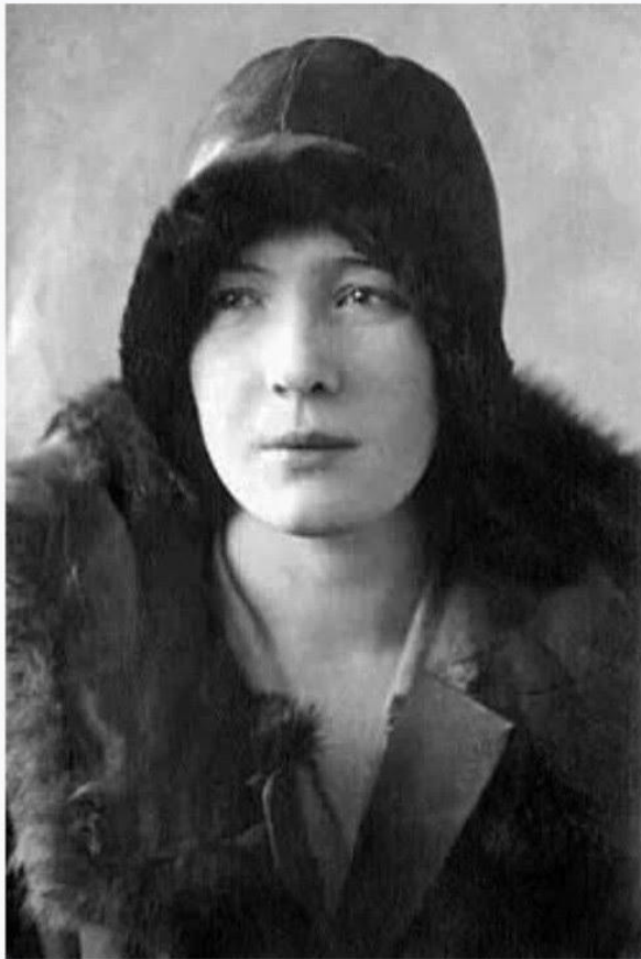
Ольга Берггольц в 1930 году