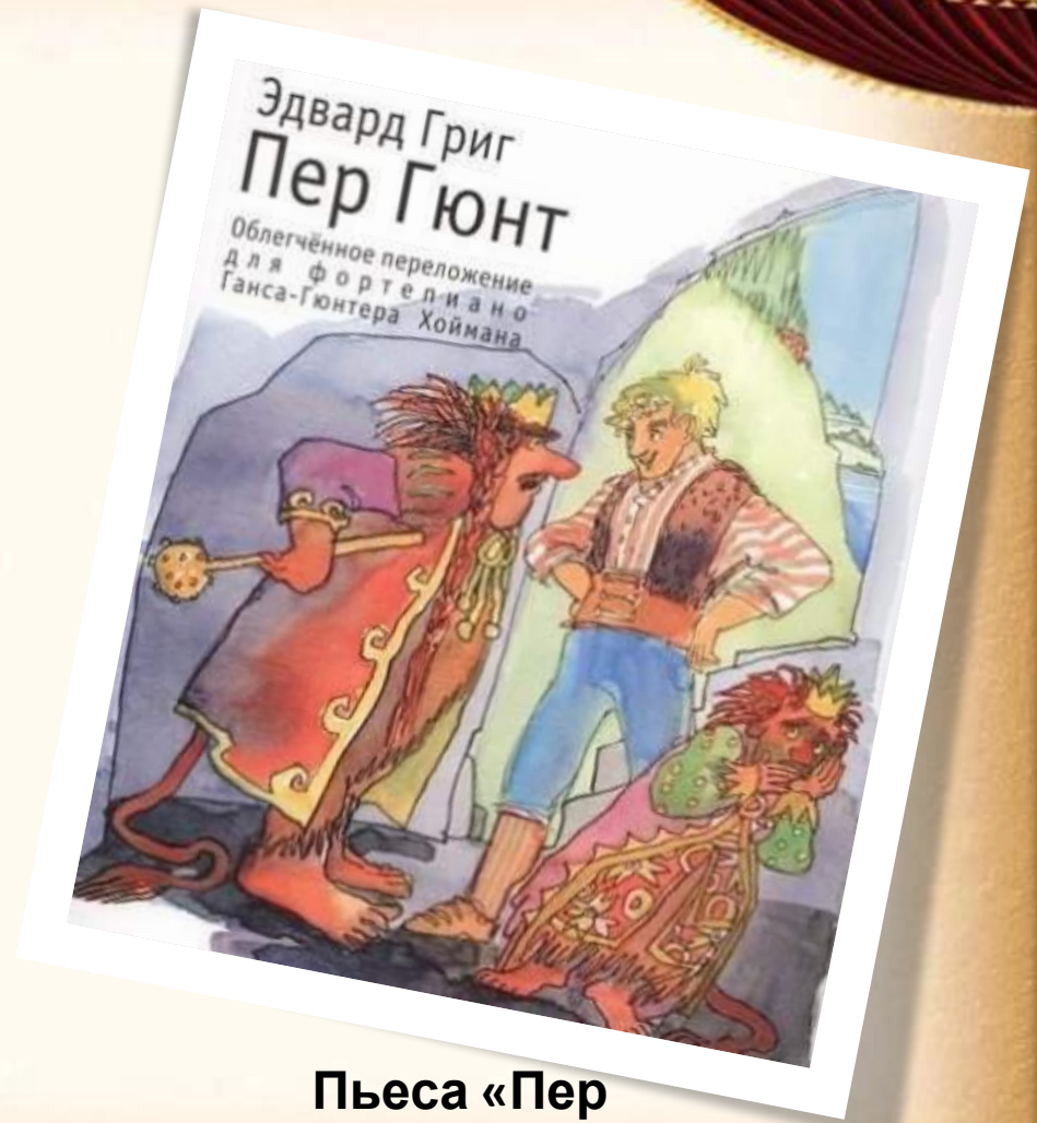
Пьеса «Пер Гюнт»