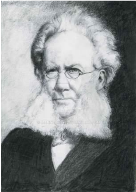
Генрик Ибсен (1828-1906) Норвежский драматург