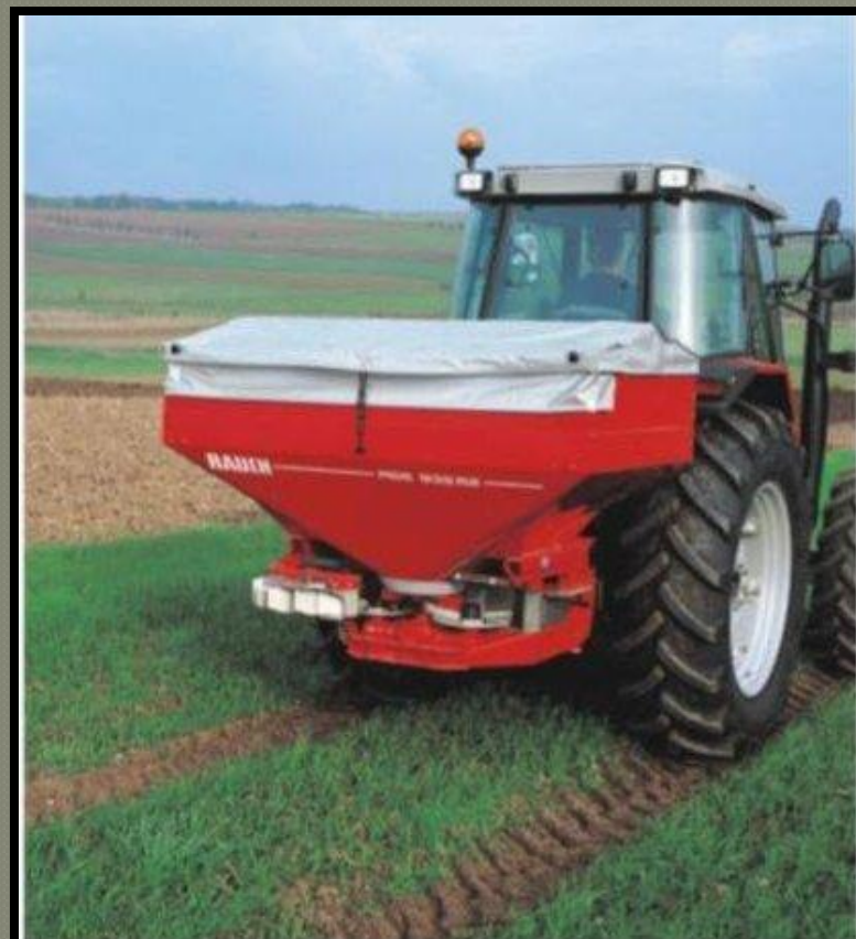
Навесной разбрасыватель минеральных удобрений Rauch MDS-935