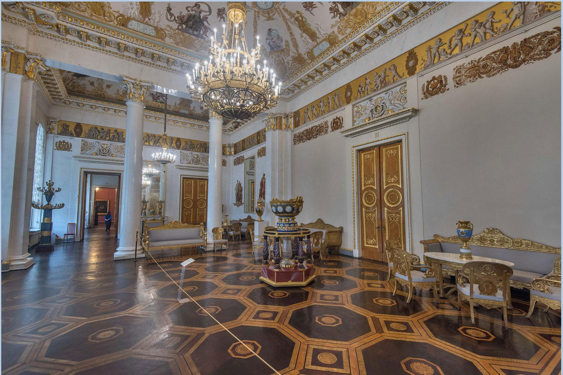
Белый (Белоколонный) зал