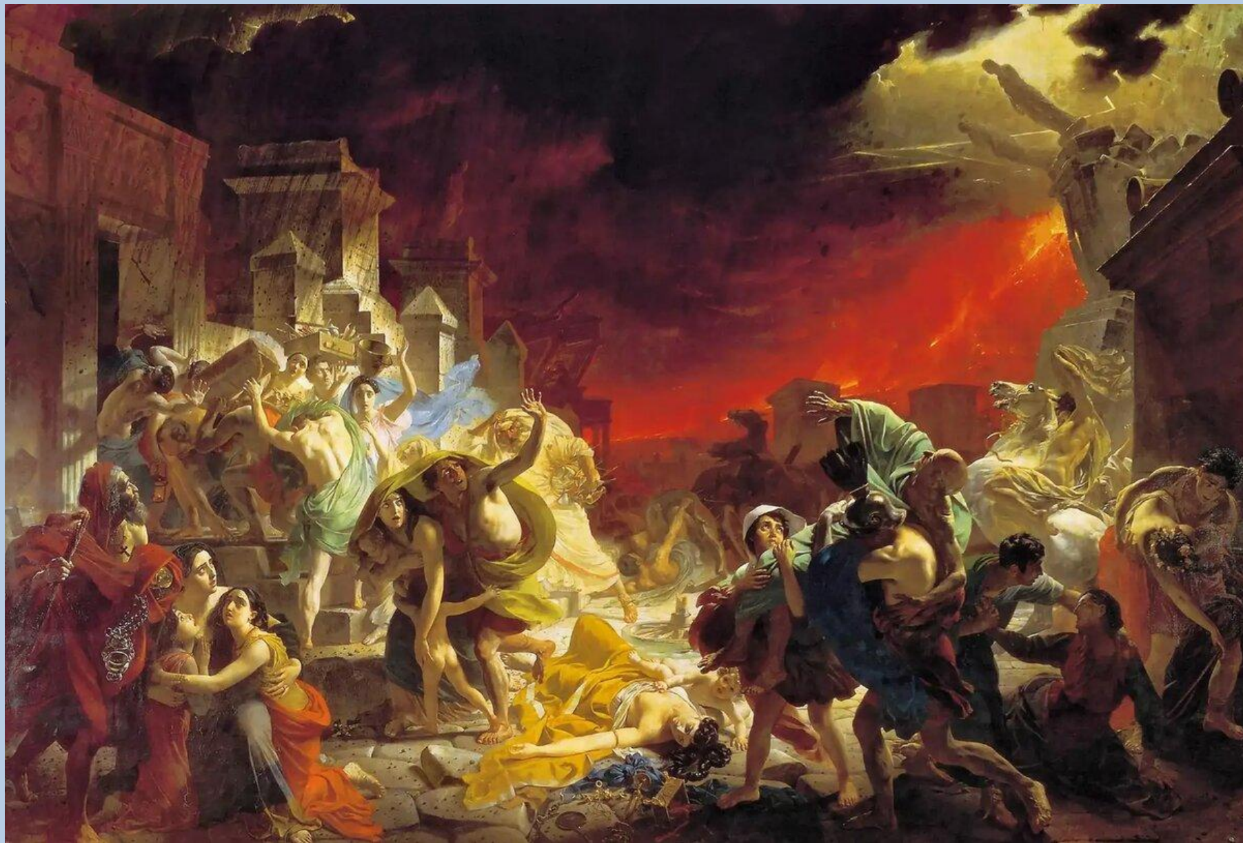
Последний путь Помпеи. Карл Брюллов. 1833г.