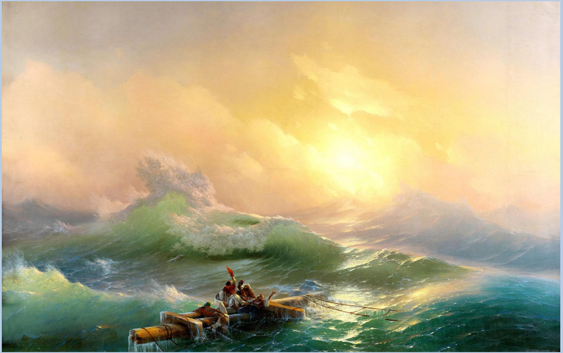
Девятый вал. Иван Айвазовский. 1850