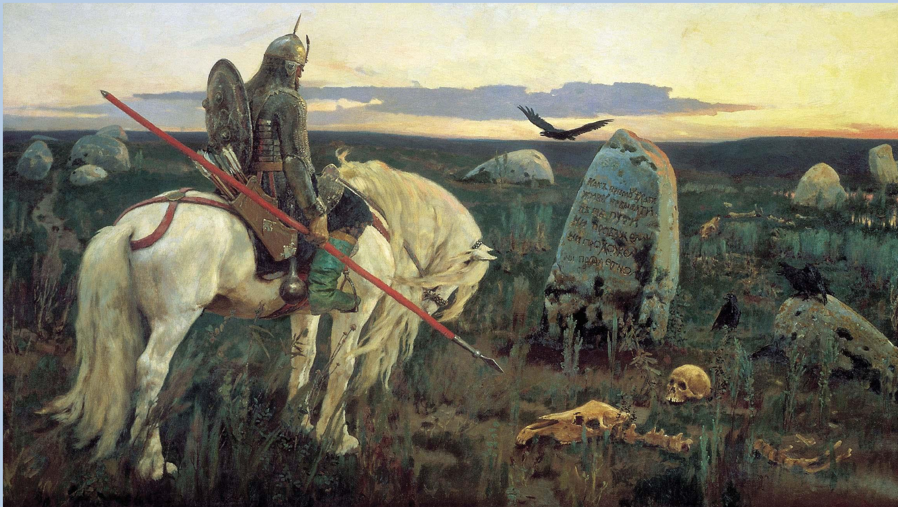
Витязь на распутье. Виктор Васнецов. 1882