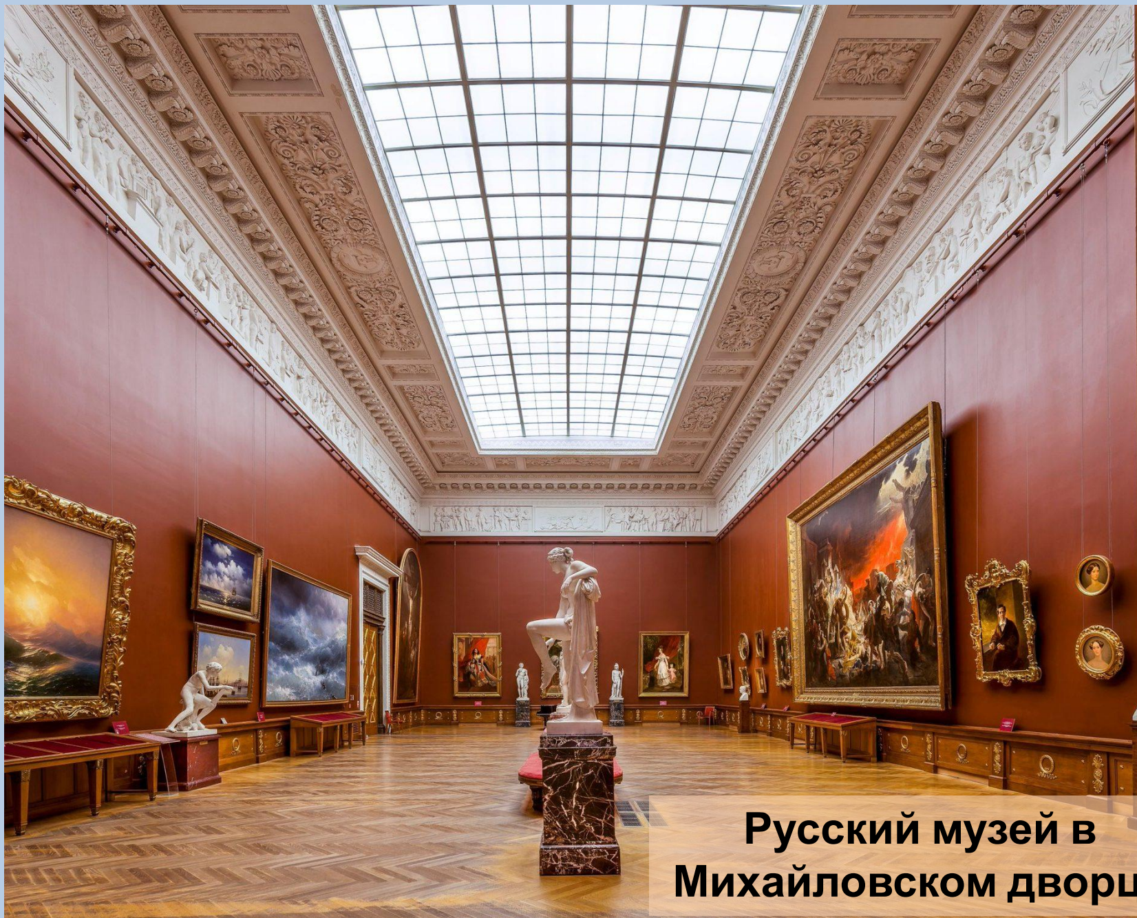
Русский музей в Михайловском дворце