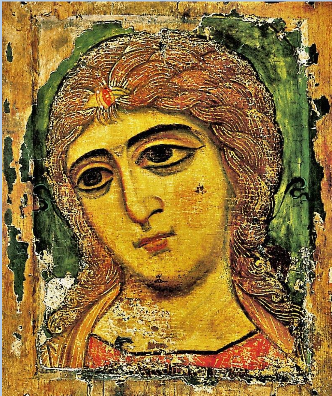
Икона Архангел Гавриил («Ангел Златые власы»). Конец XII века