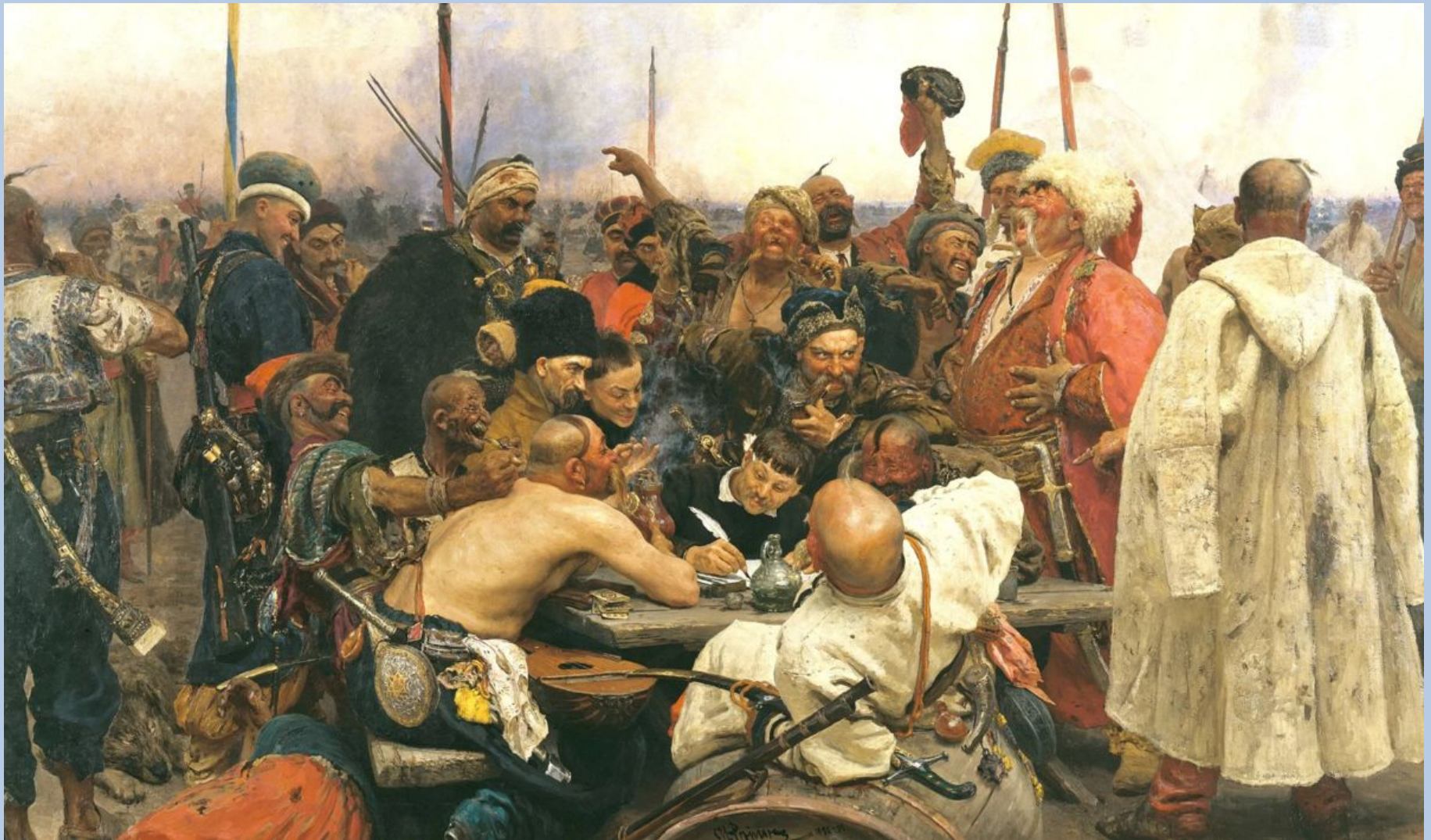
Запорожцы пишут письмо турецкому султану. Илья Репин. 1891