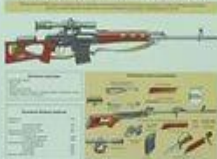
СНАЙПЕРСКАЯ ВИНТОВКА ДРАГУНОВА