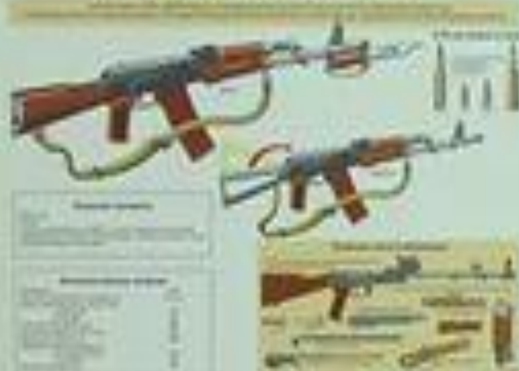
СНАЙПЕРСКАЯ ВИНТОВКА ДРАГУНОВА