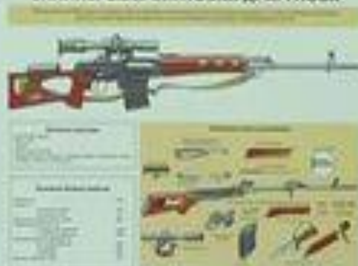
СНАЙПЕРСКАЯ ВИНТОВКА ДРАГУНОВА