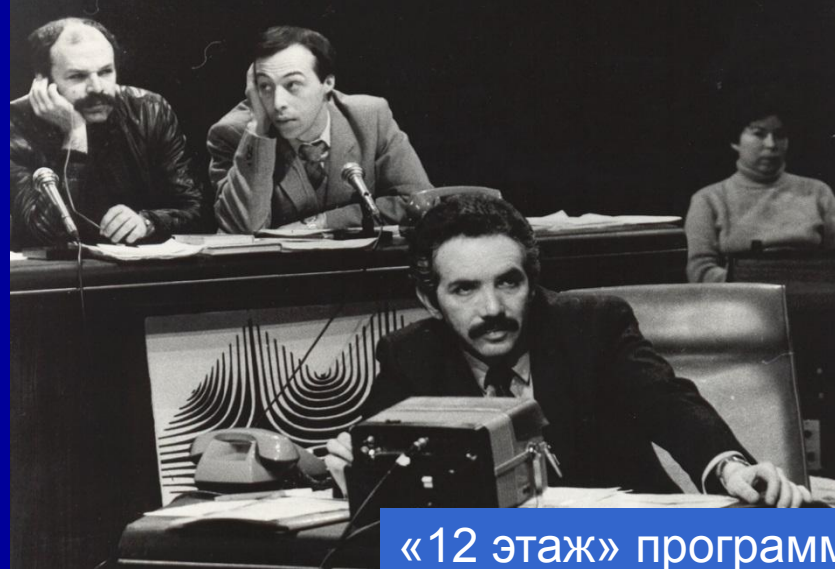
«12 этаж» программа Э. Сагалаева