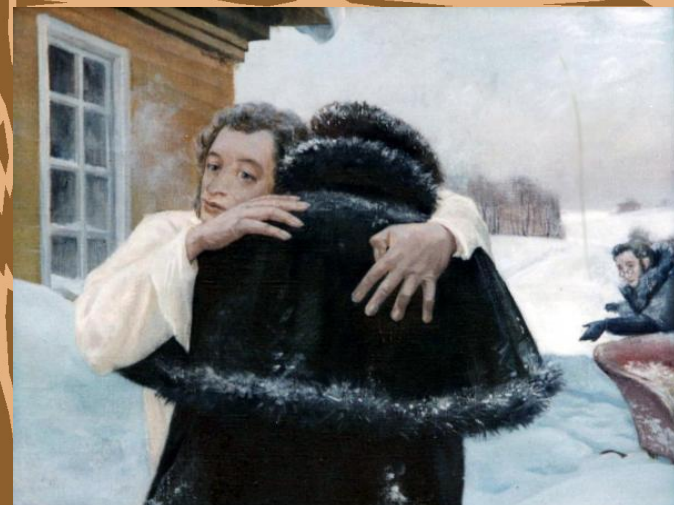
«Мой первый друг, мой друг бесценный...» А. С. Пушкин Пущину

Наконец, единственный день, проведенный вместе, - 11 января 1825 года, когда Пущин первым из друзей Пушкина посетил «поэта допальный» в Михайловском. И все. Больше они никогда не виделись».