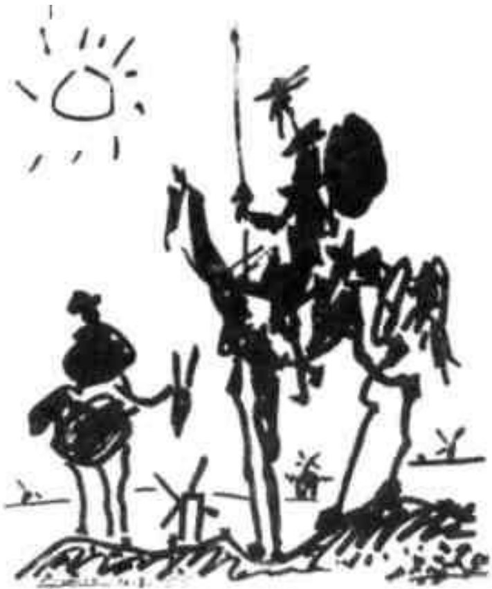
П. Пикассо. Дон Кихот и Санчо Пансо.

Идеалом бескорыстной, преданной дружбы и поныне является союз умов и сердец двух испанцев - рыцаря Дон Кихота и его оруженосца Санчо Пансы.