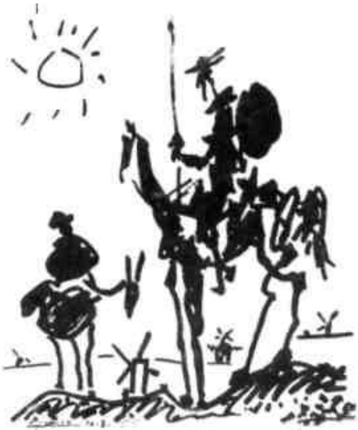
П. Пикассо. Дон Кихот и Санчо Пансо.

Идеалом бескорыстной, преданной дружбы и поныне является союз умов и сердец двух испанцев - рыцаря Дон Кихота и его оруженосца Санчо Пансы.