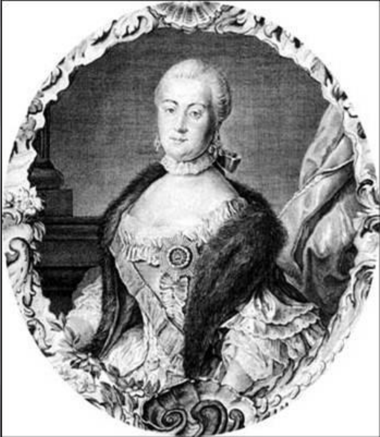
Екатерина II гравюра резцом, конец XVIII века