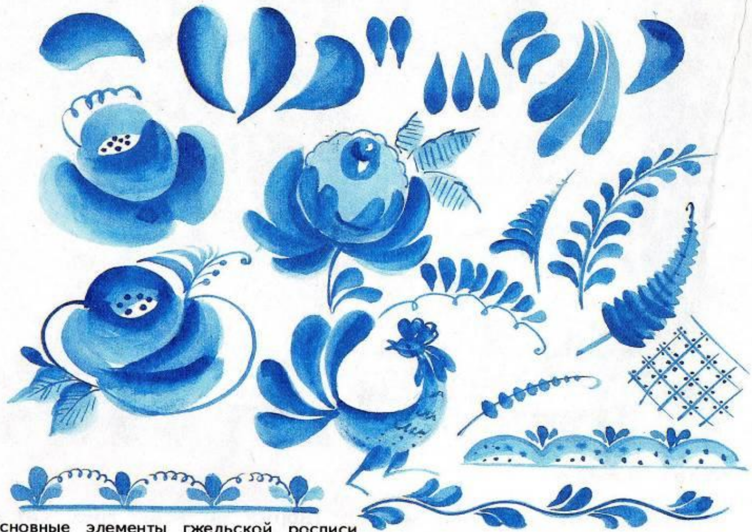
Основные элементы гжельской росписи